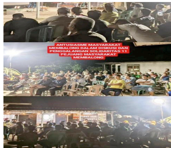
Gambar 3 Konsolidasi dan diskusi Gerakan Sosial

Demonstrasi besar pertama terjadi pada 5 Juli 2023 dan berlanjut pada 10 Juli 2023 di depan kantor bupati, mencapai puncaknya pada 16–17 Agustus 2023 dengan aksi besar-besaran. Meski beberapa aksi berujung ricuh,