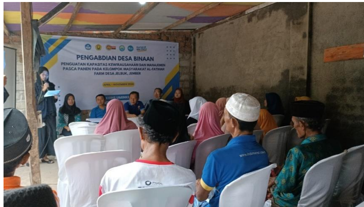
Gambar 5. Pembukaan Pelatihan Manajemen Usaha Tani dan Manajemen Keuangan