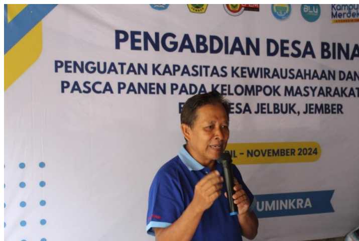
Gambar 6. Penyampaian Materi oleh Pemateri