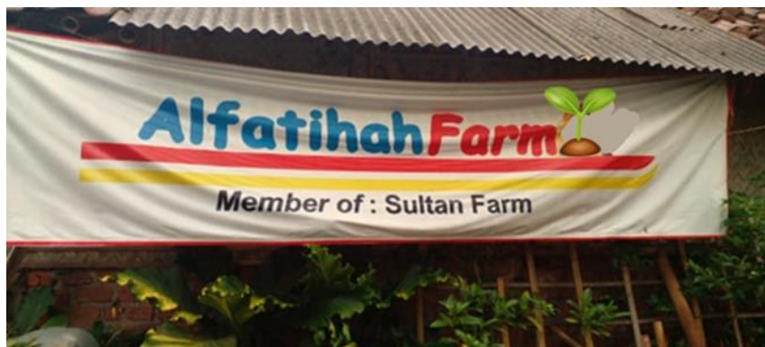
Gambar 1. Lokasi POKMAS Al Fatihah Farm

Beberapa hasil penelitian menunjukkan bahwa petani juga membutuhkan keterampilan manajemen usaha yang bagus. Berdasarkan hasil penelitian dalam kegiatan berusahatani diperlukan manajemen dalam pelaksanaannya, bila usahatani tidak maksimal dalam melakukan manajemen usahatani, maka produksi yang dihasilkan juga tidak akan maksimal (Riyanto & Iswarini, 2023). Hasil penelitian Effendi et al., (2022) juga menunjukkan bahwa manajemen agribisnis mempunyai pengaruh positif signifikan terhadap peningkatan produktivitas petani. Begitu pula dengan hasil penelitian (Hikmah & Salawati, 2019) yang menunjukkan manajemen usaha (Perencanaan, Pengorganisasian, Pelaksanaan, Pengawasan dan Evaluasi) memiliki kontribusi terhadap Peningkatan Pendapatan usahatani cengkeh.