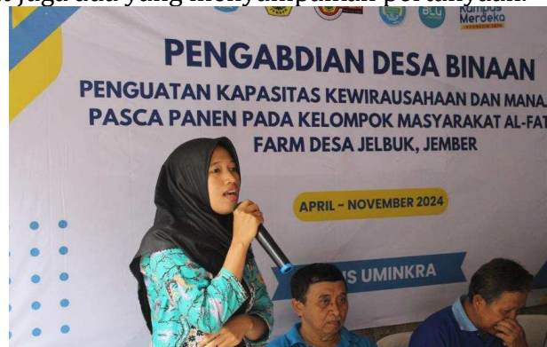
Gambar 4. Sambutan dari Ketua Pokmas Al Fatihah Farm