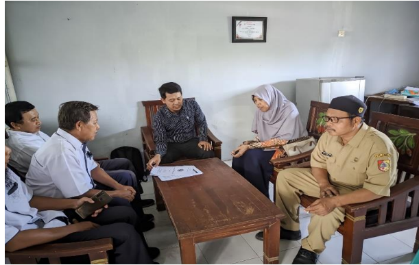
Gambar 3. Kegiatan Pengenalan Program Pengabdian