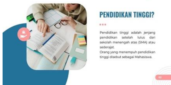
Sumber: (Dokumentasi Penulis, 2024) Gambar 5. Pengertian Pendidikan Tinggi

Setelah menjelaskan mengenai pendidikan tinggi dan arti mahasiswa, peneliti menjelaskan bahwa melanjutkan pendidikan sampai pada jenjang pendidikan tinggi adalah suatu keuntungan, karena hal ini merupakan sebuah investasi untuk mendapatkan masa depan yang lebih baik [9]. Saat kita memutuskan untuk melanjutkan pada pendidikan tinggi berarti kita sudah satu langkah lebih maju dibanding dengan teman yang tidak melanjutkan. Langkah baik ini dapat membantu kita untuk mendapatkan pengetahuan dan pembelajaran secara formal yang bisa digunakan untuk meningkatkan kemampuan dalam hidup. Pada saat melanjutkan pendidikan tinggi, sebagai calon mahasiswa bisa memilih jurusan yang sesuai dengan minat dan kemampuan diri. Kesesuaian pilihan jurusan dapat menjadi akses mahasiswa dalam membantu menggapai cita-cita di masa depan. Hal ini disampaikan penulis dengan disertai pemaparan visual pada Gambar 6.