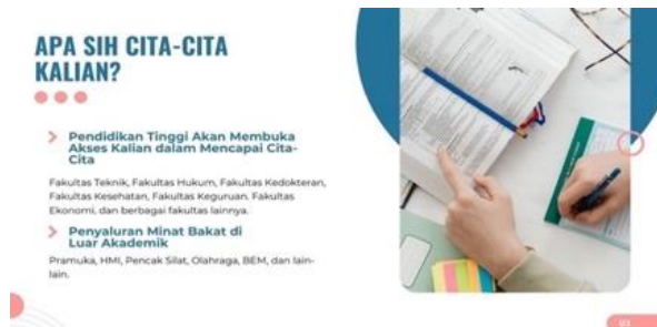
Gambar 6. Materi Pembahasan Cita-cita

Setelah menjelaskan mengenai pendidikan tinggi dan arti mahasiswa, peneliti menjelaskan bahwa melanjutkan pendidikan sampai pada jenjang pendidikan tinggi adalah suatu keuntungan, karena hal ini merupakan sebuah investasi untuk mendapatkan masa depan yang lebih baik [9]. Saat kita memutuskan untuk melanjutkan pada pendidikan tinggi berarti kita sudah satu langkah lebih maju dibanding dengan teman yang tidak melanjutkan. Langkah baik ini dapat membantu kita untuk mendapatkan pengetahuan dan pembelajaran secara formal yang bisa digunakan untuk meningkatkan kemampuan dalam hidup. Pada saat melanjutkan pendidikan tinggi, sebagai calon mahasiswa bisa memilih jurusan yang sesuai dengan minat dan kemampuan diri. Kesesuaian pilihan jurusan dapat menjadi akses mahasiswa dalam membantu menggapai cita-cita di masa depan. Hal ini disampaikan penulis dengan disertai pemaparan visual pada Gambar 6.