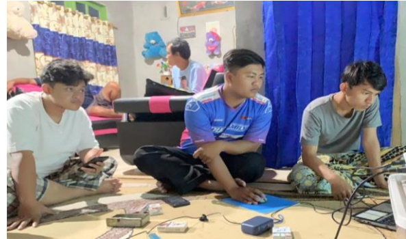
Gambar 3. Proses Penyusunan Materi Sosialisasi

bagian awal sosialisasi dimaksudkan untuk mencairkan suasana sekaligus menarik perhatian sejak menit pertama.