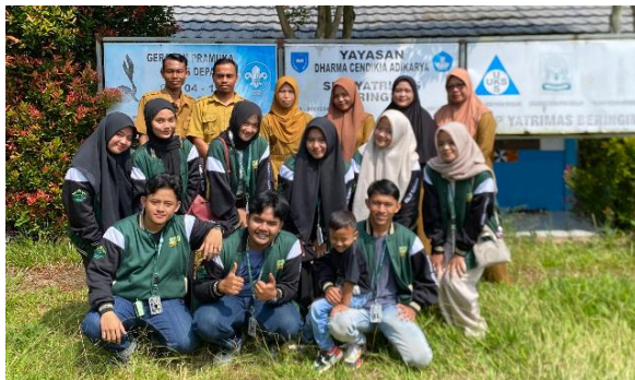
Gambar 2. Pelaksanaan Observasi di SMPS Yatrimas

Hasil observasi menunjukkan bahwa sebagian besar siswa dan siswi di sekolah tersebut tidak melanjutkan pendidikan ke perguruan tinggi setelah lulus sekolah menengah atas. Bahkan, terdapat pula yang setelah menamatkan sekolah menengah pertama langsung menikah atau bekerja. Minimnya motivasi dan kondisi ekonomi keluarga menjadi faktor utama rendahnya minat melanjutkan pendidikan. Dokumentasi kegiatan observasi ditunjukkan pada Gambar 2, yang menggambarkan proses wawancara dan diskusi bersama guru di sekolah.