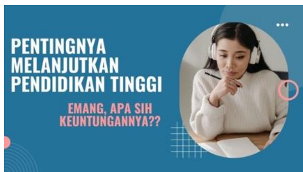
Gambar 4. Pentingnya Melanjutkan Pendidikan Tinggi

tinggi dan terdaftar dalam Pangkalan Data Pendidikan Tinggi (PDDikti) [15]. Peneliti menyampaikan, siswa adalah orang sedang belajar pada tingkatan sekolah dasar maupun menengah. Sedangkan, Mahasiswa adalah pelajar yang tingkatannya lebih tinggi. Karena, kata “Maha” berarti “besar atau paling” dan kata “Siswa” adalah “pelajar atau murid” [16].