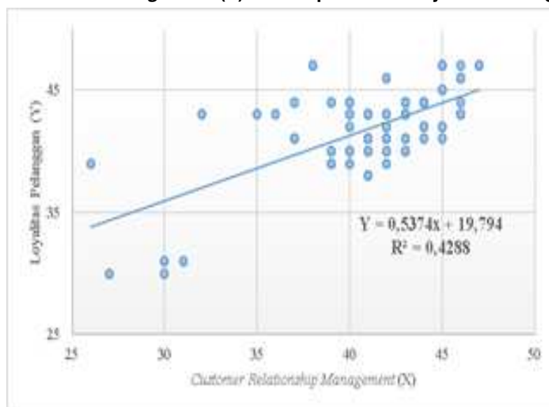
Gambar 3. Grafik Persamaan Analisa Regresi Linear Sederhana variabel Customer Relationship Management (X) terhadap variabel Loyalitas Pelanggan (Y).