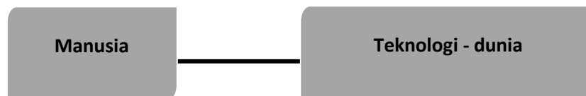
Gambar 3. Hubungan hermeneutis manusia dan teknologi

berbeda-beda, yang mana seakan cukup dengan membaca unsur dunia yang terkait. Contohnya, Ketika manusia membaca sebuah jam, dunia dalam unsur waktu dipersepsikan oleh teknologi untuk kemudian cukup manusia baca. Dalam hal ini, dunia dan teknologi seakan menyatu, yang mana dapat disimpulkan bahwa seakan jam adalah waktu itu sendiri. Hubungan yang kedua ini dapat digambarkan sebagai berikut: