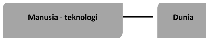
Gambar 2. Hubungan kebertubuhan manusia dan teknologi

Hubungan yang kedua adalah hubungan hermeneutis dimana alat/teknologi dibaca sebagai teks yang perlu ditafsirkan. Teknologi dalam hubungan ini seakan merupakan representasi dunia untuk membantu manusia melihat dunia. Contoh dari hubungan ini adalah thermometer, jendela, jam, penggaris, dan sebagainya. Dari contoh alat/teknologi tersebut, tiap alat mewakili atau memperlihatkan unsur dunia yang