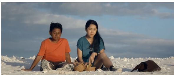
Gambar 3. Salawaku menolong saras.

Adegan ini menceritakan ditengah perjalanan salawaku melihat seorang wanita yang bernama saras yang terdampar di Gundukan Pasir Putih, Salawaku pun menghampirinya dan menanyakan apa yang terjadi, tetapi wanita itu diam saja, lalu salawaku memberikan bekal makanan kepada wanita itu dan akhirnya wanita itu bisa berbicara, Salawaku lalu memberi tumpangan dan membawa wanita itu ke daratan. Di sini Salawaku berani untuk menolong saras yang sendiri, ia menjadi pemimpin untuk membawa Saras menuju daratan, ini menunjukkan salah satu sifat maskulinitas yaitu menjadi seseorang yang penting, Salawaku menjadi penting bagi Saras karena Salawaku membantu Saras.