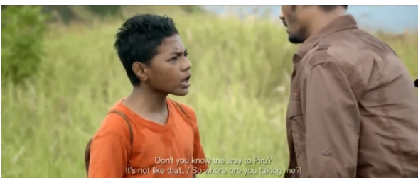
Gambar 6. Salawaku marah kepada kawanua

Adegan ini menceritakan ketika salawaku marah karena mobil yang ditumpangi ternyata