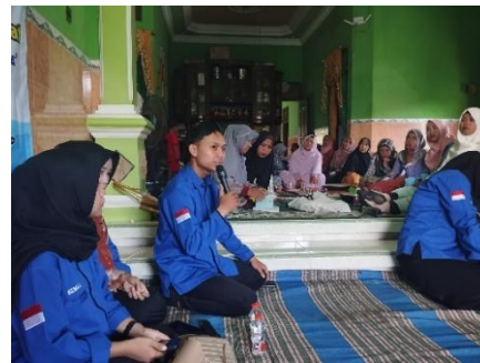
Gambar 4. Tim Kewirausahaan Menyampaikan Materi

Tahap ini Tim Kewirausahaan memberikan pengetahuan tentang pentingnya mengolah limbah gedebog pisang yang banyak ditemui di Kelurahan Krandon untuk diolah menjadi produk yang memiliki nilai kandungan gizi yang baik, enak dikonsumsi serta berdaya ekonomi. Tim Kewirausahaan menyajikan materi tentang pengolahan gedebog pisang menjadi produk banana the bog dengan disertai presentasi dan tanya jawab bersama peserta kegiatan pengabdian masyarakat.