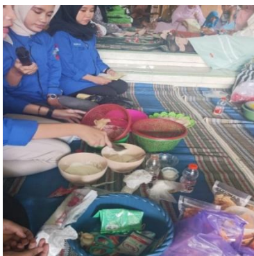
Gambar 5. Alat dan Bahan Kripik “Banana The Bog”