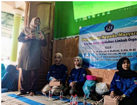
Gambar 2. Pembimbing Kewirausahaan

Kegiatan tahap penyuluhan dan sosialisasi dipandu oleh pembawa acara dari Tim Kewirausahaan Gedebog Pisang yang selanjutnya dibuka oleh Pembimbing Kewirausahaan Prodi Pendidikan Ekonomi, FKIP, Universitas Pancasakti Tegal.