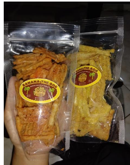
Gambar 6. Kemasan Pouch Kripik “Banana The Bog”

yang penting saat ini, apalagi di era digital seperti sekarang suatu olahan pangan harus memiliki kemasan yang menarik tetapi juga harus higienis. Untuk produk kripik “ Banana The Bog ” dikemas dengan menggunakan pouch plastic bening dengan ukuran 50gr dan 100gr, dimana dalam kemasan tersebut disertai dengan stiker sebagai tanda pengenal produk. Pada bagian luar pouch diberi label kripik “ Banana The Bog ” agar konsumen lebih tertarik untuk membeli produk kripik “ Banana The Bog ”.