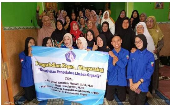
Gambar 8. Tim Kewirausahaan Bersama Mitra Abdimas

Dari kegiatan pengabdian ini diperoleh kesimpulan bahwa pengolahan limbah yang terabaikan sejak lama ternyata memberikan manfaat yang besar untuk mitra pengabdian masyarakat dan masyarakat secara umum.