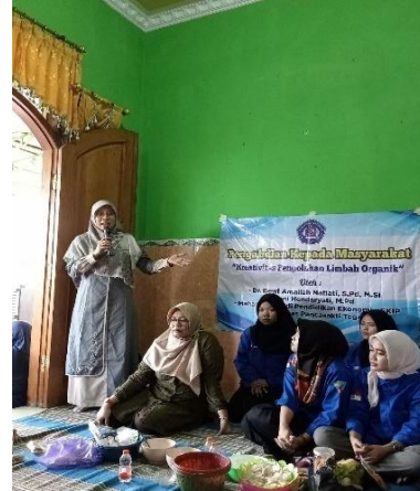
Gambar 3. Ketua Prodi Pendidikan Ekonomi

Sambutan berikutnya adalah oleh ibu ketua Prodi Pendidikan Ekonomi, FKIP, Universitas Pancasakti Tegal dan dilanjutkan oleh ibu Ketua PKK Kelurahan Krandon, Kecamatan Margadana, Kota Tegal.