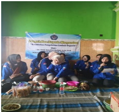
Gambar 1. Tim Kewirausahaan Memandu Acara

Pada tahap penyuluhan dan sosialisasi juga harus sudah ditetapkan tujuan yang akan dicapai Bersama dengan ibu-ibu PKK Kelurahan Krandon, Kecamatan Margadana, Kota Tegal yang berperan sebagai mitra dan peserta kegiatan pengabdian masyarakat. Sasaran pelaksanaan kegiatan masyarakat adalah ibu rumah tangga yang tergabung dalam PKK Kelurahan Krandon, Kecamatan Margadana, Kota Tegal.