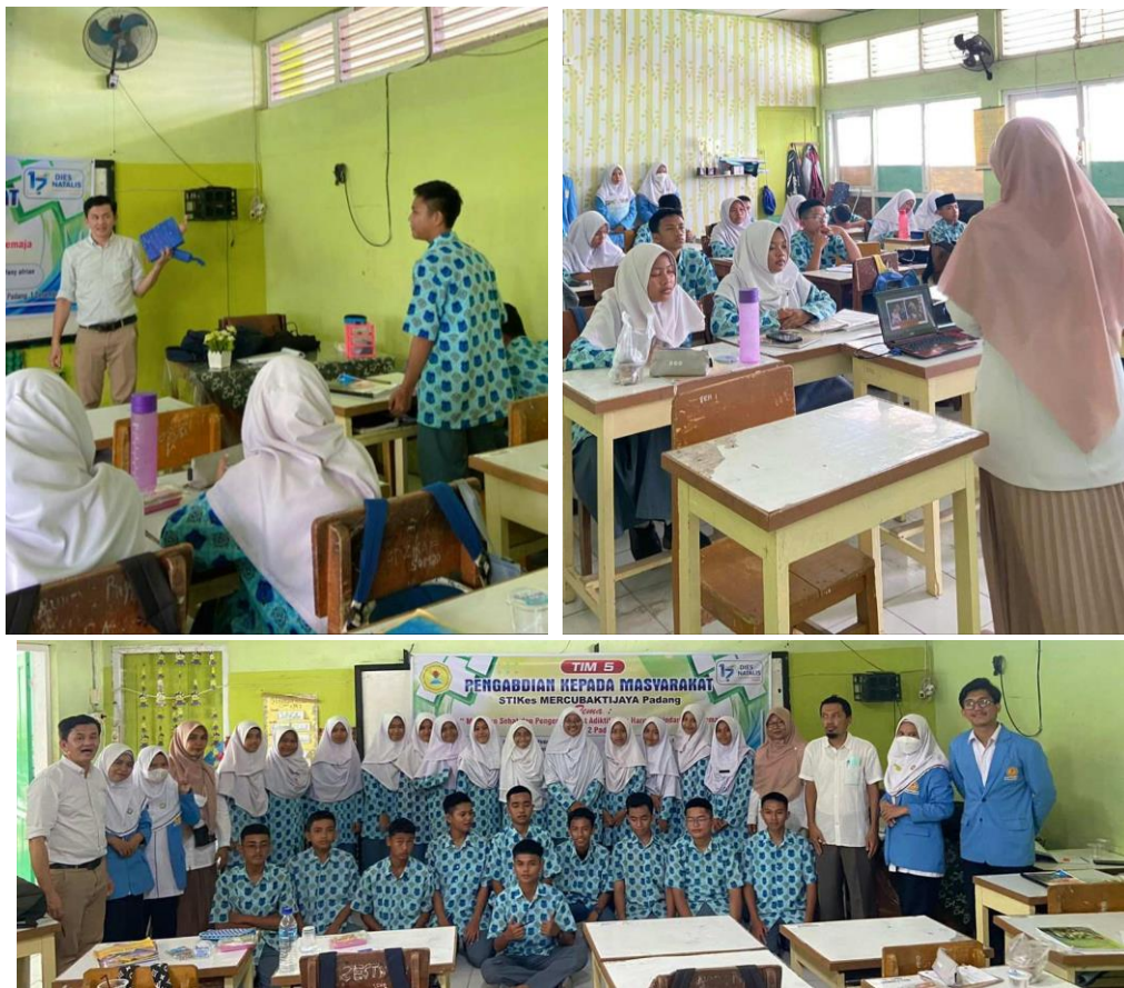
Gambar 2. Foto Kegiatan Sosialisasi

Dokumentasi pelaksanaan kegiatan pengabdian dapat dilihat pada foto kegiatan sosialisasi dan foto Bersama antara tim pengabdian dengan siswa MAN 2 Padang, yang dapat ditunjukkan pada Gambar 2 dibawah ini.