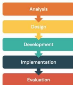
Gambar 1. Model Pengembangan ADDIE

Tahap pengembangan dilakukan dengan merealisasikan rancangan menjadi produk e-book interaktif menggunakan aplikasi Sigil. Materi disusun secara sistematis dan dilengkapi dengan elemen multimedia seperti gambar, animasi, serta fitur interaktif. Elemen visual yang dikembangkan kemudian diintegrasikan ke dalam e-book untuk mendukung pemahaman konsep. Produk yang telah selesai dikembangkan selanjutnya divalidasi oleh ahli materi dan ahli media untuk menilai kelayakan isi, tampilan, dan fungsi media pembelajaran.