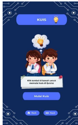
Gambar 8. Halaman Kuis