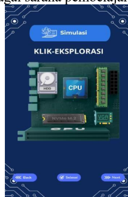
Gambar 7. Halaman Simulasi

Selain itu, tersedia tombol navigasi back untuk kembali ke halaman sebelumnya, next untuk melanjutkan ke halaman berikutnya, serta tombol finish yang menampilkan umpan balik akhir setelah proses simulasi selesai. Dengan demikian, halaman simulasi tidak hanya berfungsi sebagai media visual, tetapi juga sebagai sarana pembelajaran aktif berbasis eksplorasi mandiri.