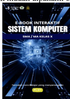
Gambar 2. Halaman Cover E-Book Interaktif

Secara keseluruhan, halaman cover dirancang dengan memperhatikan prinsip desain visual seperti keseimbangan, keterpaduan warna, dan hierarki informasi sehingga menghasilkan tampilan yang informatif, menarik, dan mudah dipahami oleh pengguna.