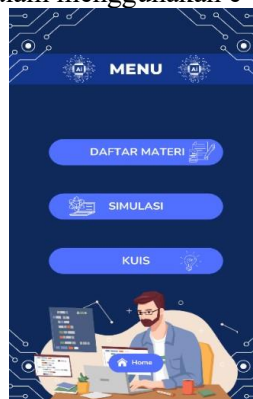
Gambar 4. Halaman Menu Utama E-Book Interaktif

Secara keseluruhan, desain halaman menu utama menggunakan dominasi warna biru dengan tema teknologi yang konsisten, sehingga menciptakan keselarasan visual serta mendukung pengalaman pengguna dalam menggunakan e-book interaktif.