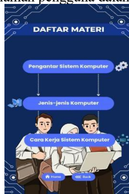
Gambar 5. Halaman Menu Daftar Materi E-Book Interaktif

Secara keseluruhan, desain halaman daftar materi menggunakan dominasi warna biru dengan tema teknologi yang konsisten, sehingga menciptakan keselarasan visual, meningkatkan keterbacaan, serta mendukung pengalaman pengguna dalam mengakses materi pembelajaran.