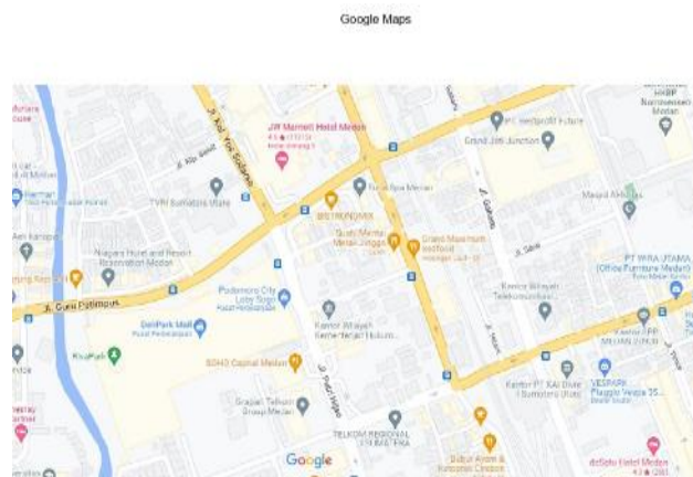
Gambar 3.2 Lokasi Penelitian

Dalam penelitian ini, lokasi survey dilakukan pada kawasan simpang TVRI seperti ditunjukkan pada Gambar 3.2 berikut.