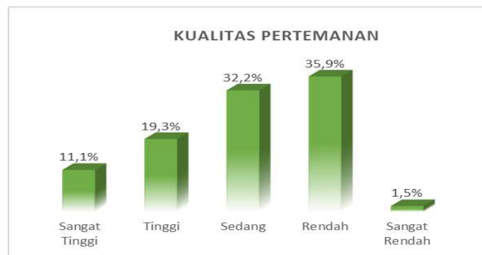
Gambar 1. Kategorisasi friendship quality

Penentuan kategorisasi dalam penelitian ini menggunakan pendekatan normatif berdasarkan nilai rata-rata (mean) dan standar deviasi (SD) sesuai dengan panduan dari Sugiyono (2019). Pendekatan ini umum digunakan dalam penelitian kuantitatif untuk mengelompokkan tingkat variabel secara objektif, sehingga dapat menggambarkan persebaran data responden dengan lebih akurat. Berdasarkan metode ini, setiap variabel dibagi menjadi lima kategori, yaitu sangat rendah, rendah, sedang, tinggi, dan sangat tinggi, dengan batasan nilai yang dihitung dari selang mean dan standar deviasi.