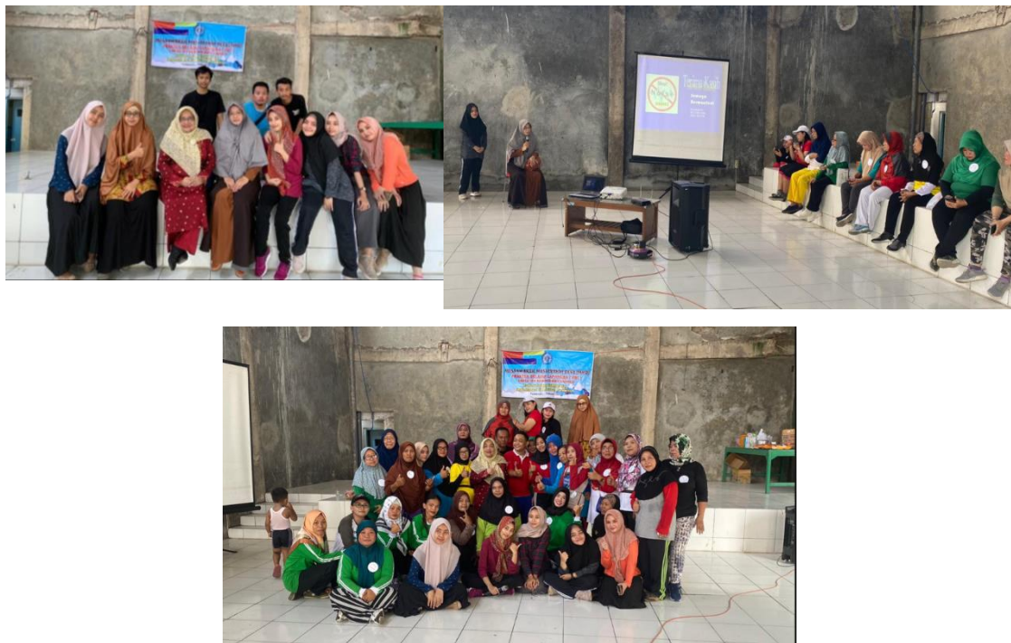
Gambar 1. Tim Pengabdian dan Peserta Penyuluhan