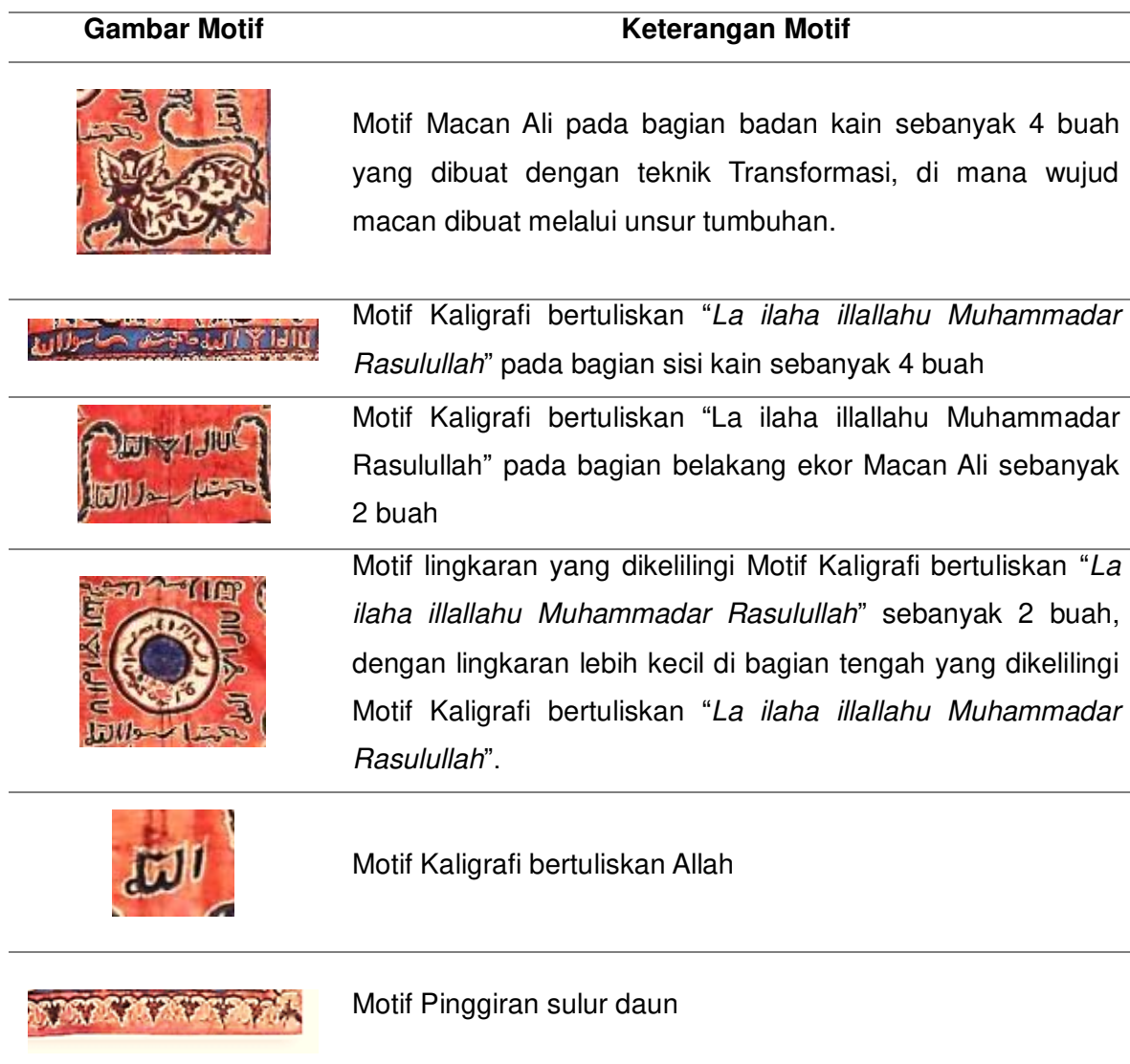
Tabel 01. Identifikasi Visual Pada Ikat Kepala Motif Macan Ali

Motif utama yang digunakan pada batik ini yaitu motif Macan Ali yang berjumlah 4 (empat) motif terdapat pada setiap sisi kain. Kemudian, beberapa motif pelengkap yang digunakan berupa motif kaligrafi tulisan Arab pada setiap sisi kain dan disisi macan Ali, serta motif lingkaran pada bagian tengah dengan motif kaligrafi memutar dan lingkaran kecil di dalamnya. Karena meskipun motif macan ali merupakan motif yang dominan lebih besar dari motif-motif lainnya, motif kaligrafi Arab lebih banyak diterapkan pada kain ini. Berikut beberapa motif yang telah diidentifikasi: