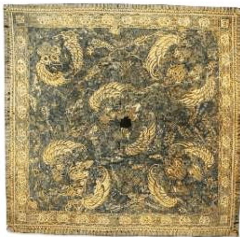
Gambar 02. Kain Ikat Kepala Motif Sawat

Ikat kepala motif Sawat dibuat dengan teknik batik tulis pada media kain katun. Kain ini berukuran 88 x 85 cm dengan warna latar yaitu biru dan kombinasi warna putih dan cokelat terang. Sama seperti kain pertama, kain ini merupakan koleksi yang didapatkan dari sumbangan GP. Mangkunegoro VIII pada tahun 1976. Kondisi kain memiliki tambalan akibat sobek, berlubang di beberapa bagian dan terdapat noda sehingga beberapa motif sudah tampak kurang jelas dan beberapa tidak terlihat.