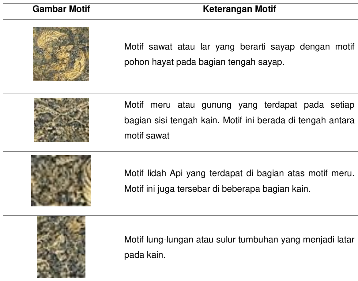
Tabel 02. Identifikasi Visual Pada Ikat Kepala Motif Sawat

Motif utama pada kain ikat kepala ini yaitu motif sawat atau yang berarti sayap dengan beberapa motif pohon hayat, meru (gunung), lidah, sulur tumbuhan dan motif pinggiran (pengada) di bagian tepi kain. Selain itu, terdapat juga isian pada motif yang disebut dengan isen-isen berupa cecek (titik), cecek pitu (titik tujuh), ukel, cecek sawut (titik garis) dan ular-ularan. Dikarenakan kondisi kain yang sudah mengalami kerusakan dan beberapa motif tampak tidak terlihat, maka untuk mengidentifikasi motif pada batik ini dilakukan dengan menaikkan ketajaman gambar. Hal tersebut dilakukan agar garis motif dapat lebih terlihat jelas dan mudah dikenali. Berikut hasil identifikasi motif pada kain ikat kepala motif sawat: