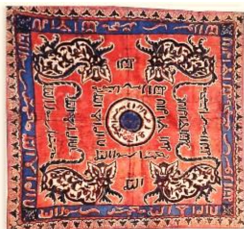
Gambar 01. Kain Ikat Kepala Motif Macan Ali

Ikat kepala motif Macan Ali dibuat dengan teknik batik tulis pada media kain katun. Kain terbuat dari teknik anyaman pipih yang dibuat secara manual dengan alat tenun tradisional yang disebut alat tenun gedhog. Kain ini merupakan koleksi yang didapatkan dari sumbangan GP. Mangkunegoro VIII pada tahun 1976. Ukuran kain yaitu 86,5 x 83,5 cm dengan warna latar cokelat kemerahan dan kombinasi warna lain seperti biru, hitam dan putih. Kondisi kain memiliki tambalan akibat sobek dan berlubang di beberapa bagian, namun untuk motif dan warna masih tampak baik dan masih terlihat dengan jelas.