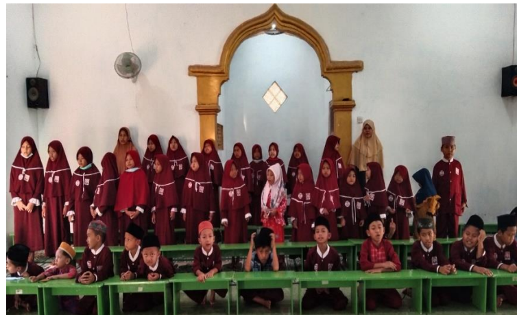
Peserta didik Madin Awaliyah Ulul Albab :