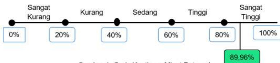
Gambar 1. Garis Kontinum Minat Peternak

disampaikan. Selama penyuluhan terkait dapat dikatakan antusias responden tinggi, terlihat dari keaktifan responden dan juga dilihat dari cara responden yang terbuka dalam menerima mahasiswa beserta materi yang akan disuluhkan. Garis kontinum minat peternak dapat dilihat pada gambar 1 sebagai berikut.