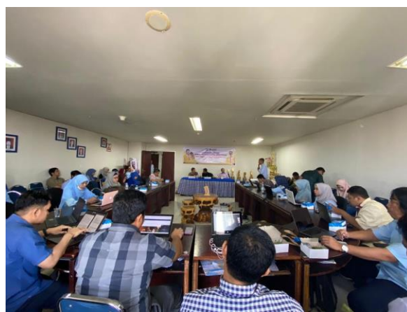
Gambar 1. Proses Pemberian Materi Pelatihan