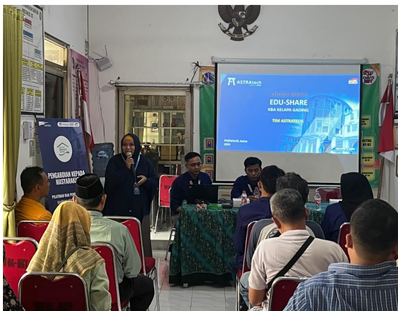
Gambar 1. Sharing Edukasi KBA Klapa Gading Tentang Panel Surya