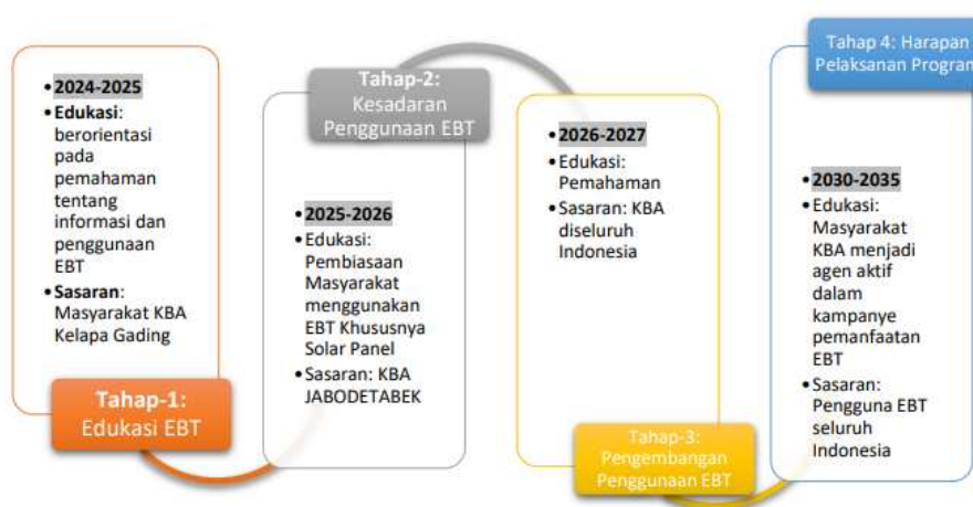
Gambar 2. Roadmap Pelaksanaan Kampung Berseri Astra (KBA) Kelapa Gading Berbasis Energi Bersih

Selain itu, salah satu dampak utama dari program ini adalah meningkatnya pemahaman masyarakat tentang pentingnya pemanfaatan energi terbarukan. Dengan berpartisipasi aktif dalam instalasi dan pelatihan, masyarakat tidak hanya semakin sadar akan manfaat energi surya, tetapi juga menjadi lebih mandiri dalam penggunaannya. Warga RW dan guru di PAUD diajarkan bagaimana mengoptimalkan penggunaan energi surya dalam kehidupan sehari-hari, serta menanamkan sikap peduli terhadap keberlanjutan lingkungan. Dengan demikian, program ini berhasil memberikan solusi energi yang efektif sekaligus meningkatkan literasi masyarakat tentang energi terbarukan.