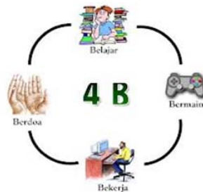
Gambar 1. Architecture iLearning 4B

Salah satu terobosan baru yang dilakukan oleh Perguruan Tinggi Raharja adalah telah menciptakan dan menerapkan teknologi iLearning dalam proses pembelajaran bagi seluruh Pribadi Raharja. Pada dasarnya istilah iLearning (Integrated Learning) berasal dari pemikiran perkembangan teknologi iPad di Perguruan Tinggi Raharja. iLearning dikemas secara khusus untuk kegiatan proses pembelajaran secara online. Dari sistem belajar online, maka dapat diperoleh manfaat yaitu seperti fleksibilitas, jangkauan lebih luas, menghemat biaya, dan mempermudah penyempurnaan dan penyimpanan materi pembelajaran. Dalam iLearning terdapat istilah 4B, yaitu belajar, bekerja, berdoa, dan bermain. Melalui metode iLearning ini saya ingin menunjukkan konsep “paperless” yang mampu mengurangi penggunaan kertas di dalam kegiatan belajar mengajar [1].