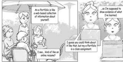
Gambar 3. Figure ilustrasi portofolio mahasiswa

Pada gambar figure ilustrasi portofolio mahasiswa dalam membuat CV online dapat memudahkan Pribadi Raharja untuk membuat sebuah CV yang berkualitas, dapat dilakukan pula dengan jalan alternatif yang memudahkan untuk melakukan proses tersebut, yaitu melalui flowchart. Dan dibawah ini merupakan gambaran flowchart alur program yang berjalan dari sistem untuk membuat e-portofolio atau CV online.