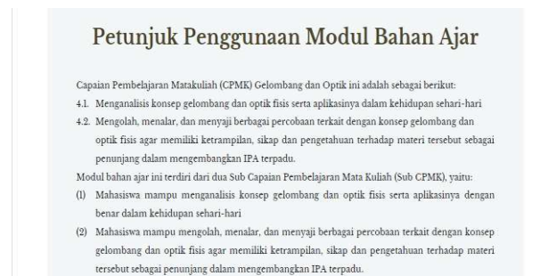
Gambar 4. Penambahan CPMK dan Sub CPMK

Sedangkan berdasarkan angket respon mahasiswa, hasil yang diperoleh adalah sebagai berikut: