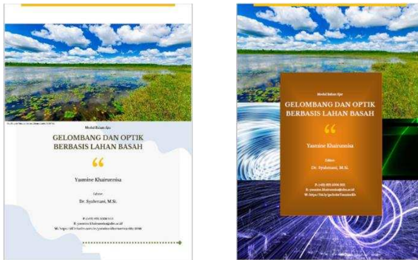
Gambar 3. Cover modul sebelum dan sesudah revisi

Berdasarkan hasil validasi pada tabel 1 di atas, semua aspek dalam modul terkategori sangat baik karena memperoleh nilai lebih dari 3.50 dan rata-rata 3.8825, dengan persentase kelayakan sebesar 97.06% (validitas tinggi) sehingga modul ini termasuk dalam kriteria layak untuk digunakan dalam perkuliahan. Namun, ada revisi minor yang dilakukan berdasarkan saran dari validator yaitu penambahan CPMK dan Sub-CPMK, serta perubahan sampul atau cover modul menjadi lebih representatif terhadap materi ajar. Berikut perubahan yang dilakukan pada modul.