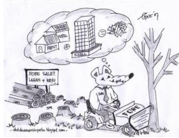
Contoh Gambar 1:

Berdasarkan foto dibawah ini,buatlah sebuah karangan berupa teks anekdot sesuai dengan struktur dan kaidah kebahasaannya!