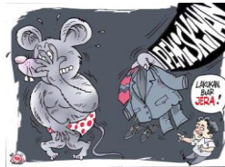
Contoh Gambar 2 :

Berdasarkan foto dibawah ini,buatlah sebuah karangan berupa teks anekdot sesuai dengan struktur dan kaidah kebahasaannya!