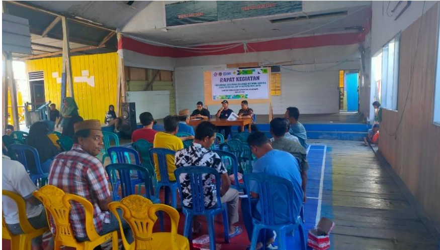
Gambar 7: Rapat penyusunan Data Penerima Akses RA

Hasil pemetaan sosial di Desa Torosiaje/Laut menunjukkan bahwa karakteristik sosial ekonomi masyarakat sangat dipengaruhi oleh kondisi permukiman pesisir dan ketergantungan terhadap sumber daya laut. Masyarakat yang menjadi subjek kegiatan merupakan warga yang telah memperoleh legalisasi aset berupa sertipikat hak pakai, sehingga memiliki kepastian hukum sebagai dasar pengembangan kegiatan ekonomi melalui penataan akses reforma agraria.