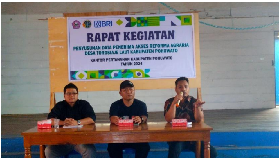
Gambar 6: Pemaparan Hasil Pemetaan Sosial

Data hasil pemetaan sosial dianalisis secara deskriptif kualitatif dan dibahas melalui forum sarasehan/pertemuan partisipatif bersama masyarakat dan pemangku kepentingan. Tahapan ini bertujuan memvalidasi data lapangan serta merumuskan arah dan strategi pemberdayaan ekonomi yang sesuai dengan kondisi lokal.