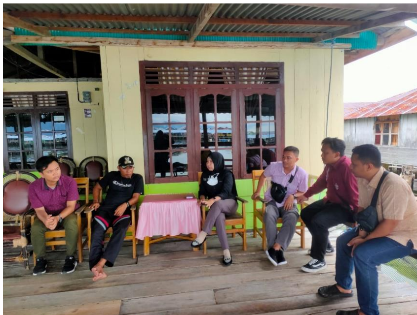
Gambar 3: Koordinasi Tim dengan Kepala Desa Torosiaje terkait Penyuluhan RA

Penyuluhan dilaksanakan untuk memberikan pemahaman kepada masyarakat dan pemangku kepentingan terkait mengenai konsep reforma agraria, tujuan penataan akses, serta tahapan kegiatan Fase I. Kegiatan ini bertujuan membangun partisipasi aktif masyarakat dan menyamakan persepsi antara Pemerintah Daerah, perangkat desa, lembaga keuangan, dan Masyarakat subjek reforma agraria