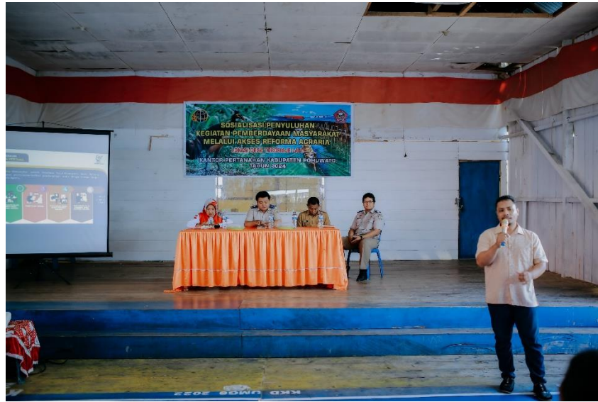
Gambar 4: Penyuluhan RA Penataan Akses Fase I di Aula Desa Torosiaje