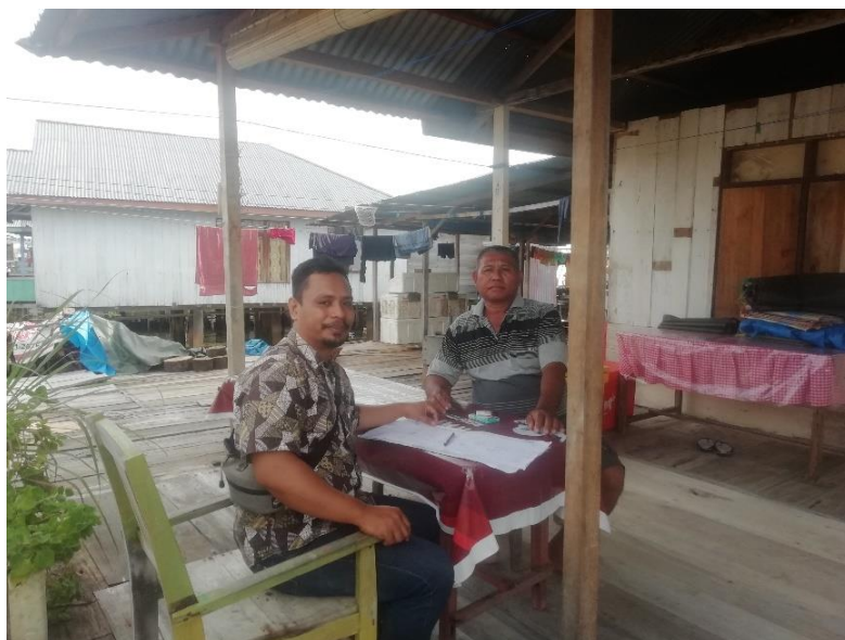
Gambar 5: Sampel Pemetaan Sosial (sektor usaha: olahan ikan Asin)

Pemetaan sosial merupakan tahapan inti dalam kegiatan Fase I. Metode yang digunakan yaitu, Pertama, Wawancara terstruktur menggunakan kuesioner kepada kepala keluarga/subjek reforma agrarian. Kedua, Observasi lapangan untuk mengidentifikasi kondisi permukiman, usaha, dan lingkungan Ketiga, Pendataan sosial ekonomi meliputi data tenurial, jenis usaha, tingkat pendapatan, aset produktif, dan kelembagaan ekonomi. Pemetaan sosial dilakukan untuk mengidentifikasi potensi, permasalahan, serta kebutuhan masyarakat sebagai dasar penyusunan model penataan akses.