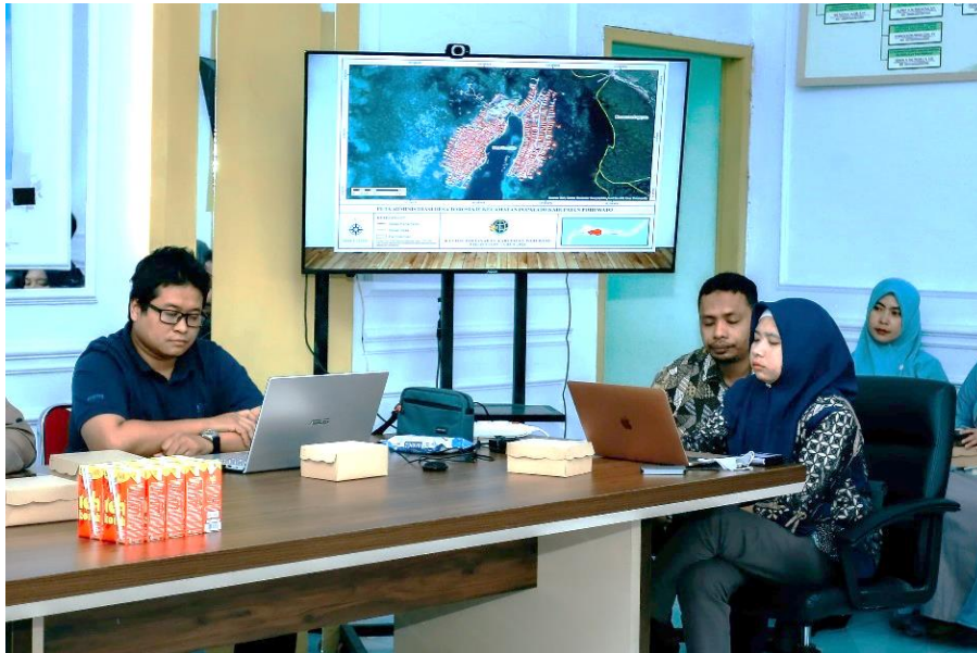
Gambar 2: Rapat Penetapan Lokasi Penataan Akses Fase I