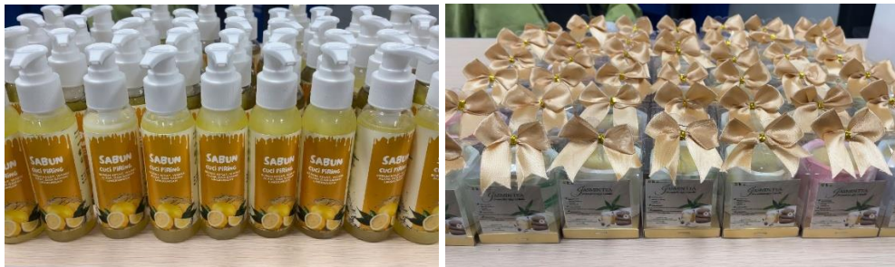
Gambar 1. Hasil packaging produk sabun cuci piring dan lilin aromaterapi dari minyak jelantah

Secara keseluruhan, kegiatan pengabdian ini memberikan dampak positif terhadap peningkatan pengetahuan, kreativitas, dan kesadaran lingkungan masyarakat Desa Plalangan. Produk sabun cuci piring dan lilin aromaterapi kini memiliki kemasan yang lebih menarik dan siap dipasarkan, baik secara langsung maupun melalui platform digital. Meskipun belum sampai pada tahap penjualan mandiri secara berkelanjutan, kegiatan ini telah menjadi langkah awal yang penting dalam membangun kesiapan masyarakat menuju pengembangan wirausaha desa berbasis ekonomi sirkular. Pendampingan lanjutan masih diperlukan agar kemampuan pemasaran digital dan produksi dapat terus ditingkatkan secara berkelanjutan.