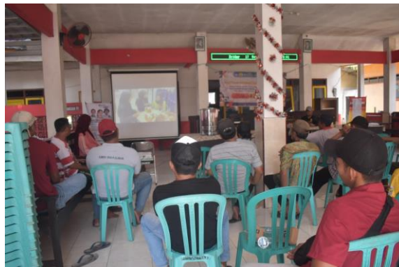
Gambar 2. Pemaparan materi marketing kepada peserta sosialisasi