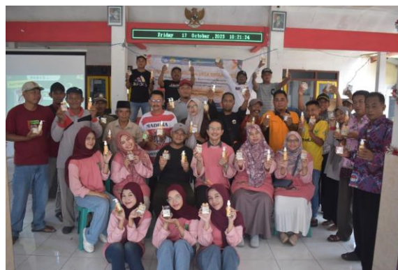
Gambar 3. Foto bersama warga dan tim pengabdian