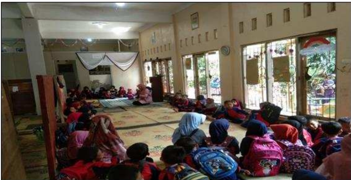
Gambar 2. Kegiatan Sosialisasi Penanaman Nilai Entrepreneurship

Pelaksanaan sosialisasi ini bertempat di Gedung PAUD Mutiara Kids Desa Traji Kabupaten Temanggung. Kegiatan ini dilakukan dengan menyampaikan materi dan demonstrasi. Kegiatan sosialisasi dan pelatihan dimulai dengan tahap pengenalan narasumber dari tim PkM, kemudian dilanjutkan dengan pemberian materi kepada masyarakat. Seluruh peserta PkM diberikan wawasan mengenai entrepreneurship dan nilai-nilai karakter berwirausaha sejak usia dini.