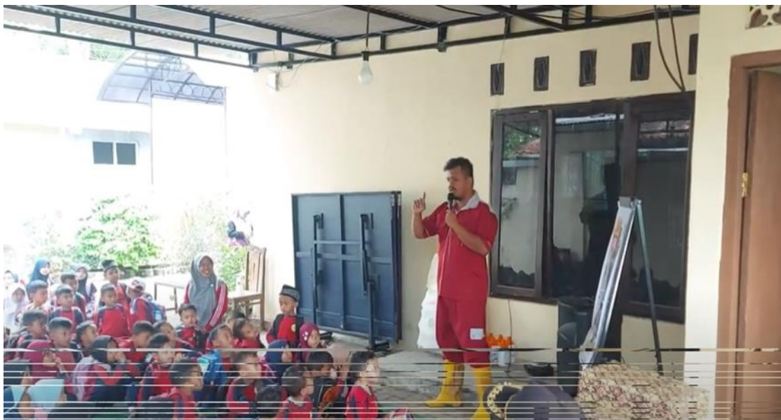
Gambar 3. Penyampaian Materi dari Dinas Peternakan dan Kesehatan Hewan Provinsi Jawa Tengah