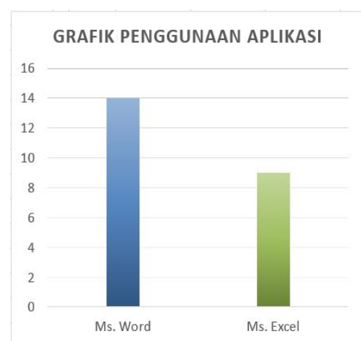
Gambar 1. Grafik Penggunaan Aplikasi

Berdasarkan data yang diperoleh dari 20 orang peserta yang hadir pada kegiatan pelatihan, terdapat 14 orang yang sebelumnya pernah menggunakan Ms Word dan hanya 9 orang diantaranya yang pernah menggunakan Ms. Excel. Adapun penggambaran familiarisme peserta terhadap aplikasi yang digunakan dapat dilihat pada gambar 1.