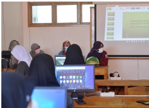
Gambar 2. Pemaparan Materi

Kegiatan pelatihan dilakukan dengan membagi tugas masing-masing anggota. Ada yang bertugas sebagai narasumber yang memaparkan materi dan anggota lain bertugas sebagai pendamping yang membantu peserta secara langsung ketika mengalami kendala.