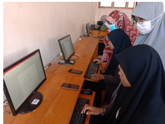
Gambar 3. Proses Pendampingan dari Dosen

unsur dosen maupun mahasiswa dari Program Studi Teknik Informatika.