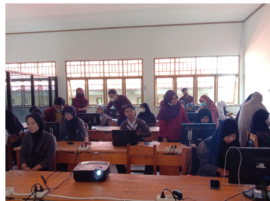
Gambar 4. Praktik yang Didampingi Tim Pelaksana dari Unsur Dosen dan Mahasiswa

Dari kegiatan yang telah dilakukan, diketahui bahwa masih terdapat beberapa siswa yang belum familiar dengan penggunaan aplikasi yang diajarkan. Untuk memastikan bahwa tujuan kegiatan dapat tercapai, maka tim pelaksana kegiatan melakukan pendampingan bagi siswa yang merasa kesulitan. Pendampingan dilakukan dengan terlebih dahulu melakukan screening kepada siswa pada saat materi berlangsung. Proses screening ini dilakukan mengingat jumlah peserta dan jumlah anggota tim pelaksana tidak seimbang sehingga tidak dapat dilakukan pendampingan satu per satu. Dari proses screening , apabila dilihat bahwa terdapat siswa yang tidak dapat mengikuti, maka anggota tim pelaksana kegiatan akan membantu mengarahkan.