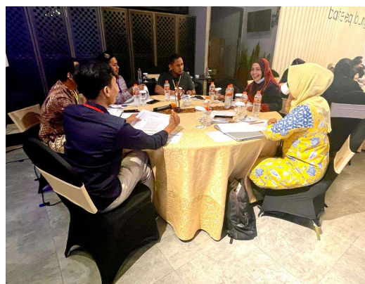
Gambar 1. Kegiatan workshop

Workshop yang diselenggarakan berbentuk pelatihan bagi guru. Tujuannya adalah untuk memberikan wawasan dan pemahaman mengenai model pembelajaran yang mengintegrasikan mata pelajaran dengan literasi keagamaan lintas budaya. Proses pelatihan ini diilustrasikan dalam Gambar 1.