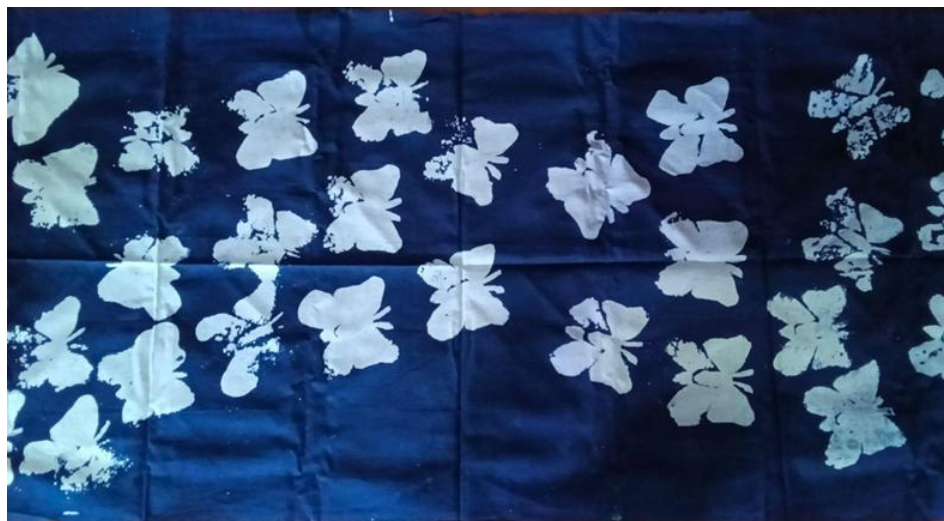
Gambar 3. Gambar urban butterfly

Visual tradisional. Dinamika visual yang dihasilkan menunjukkan komposisi yang lebih bebas, spontan, dan tidak terikat oleh aturan motif lama. proses kreatif siswa berlangsung tanpa tekanan atau batasan yang ketat, sehingga ruang ekspresi menjadi lebih luas dan dinamis. Dengan demikian, motif yang tercipta menampilkan karakter kebebasan atau sifat “merdeka” dan berekspresi, yang mencerminkan identitas remaja sebagai kelompok yang tengah membangun cara pandang dan bahasa visualnya sendiri.