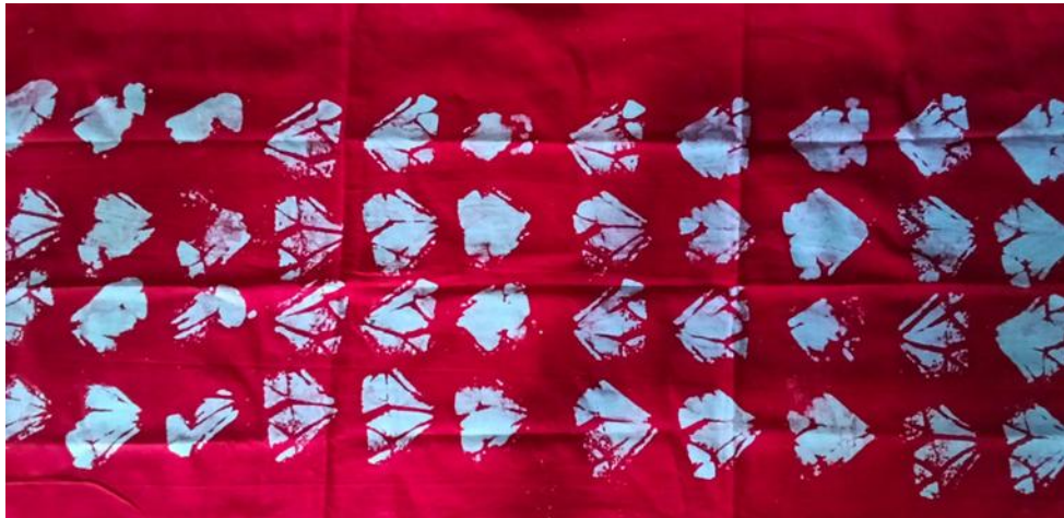
Gambar 6. Gambar diamond

rapi dan tidak padat, sejalan dengan preferensi estetika Gen Z yang mengutamakan kesederhanaan namun tetap bermakna.