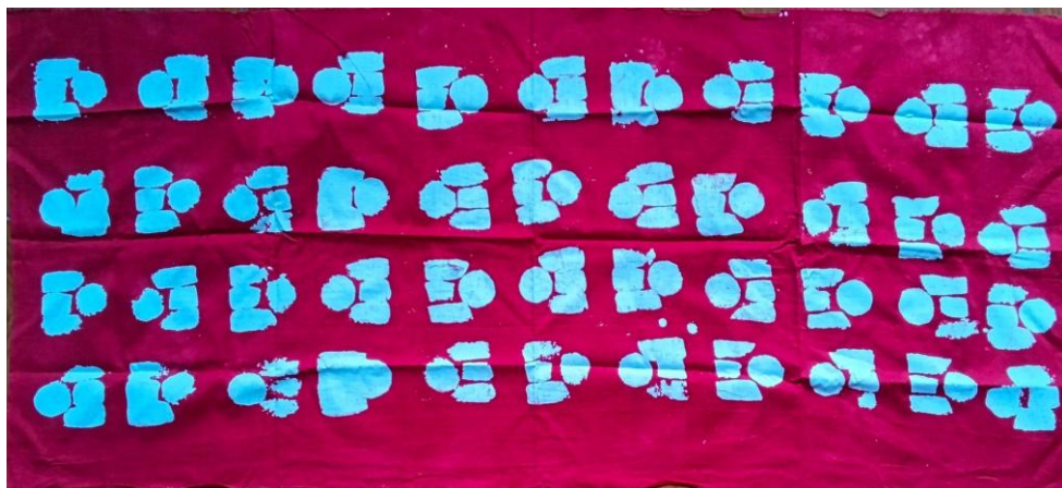
Gambar 7. Gambar ruang dan bentuk