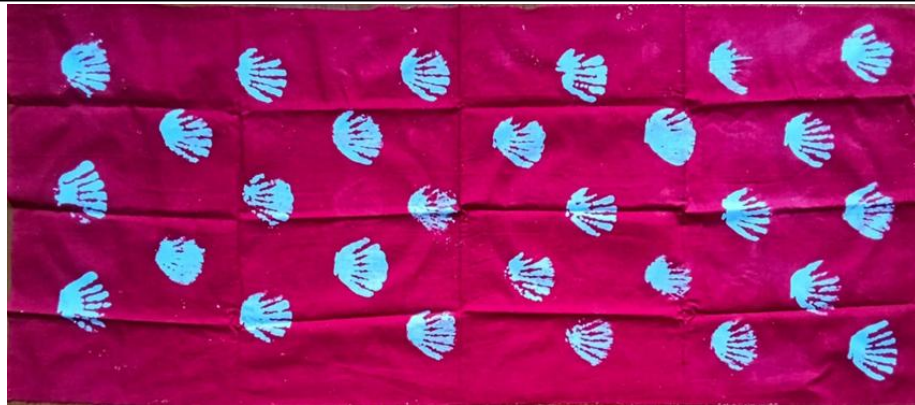
Gambar 1. Gambar kerang