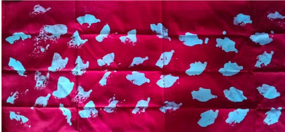
Gambar 4. Gambar daun

dengan makna daun sebagai simbol kebebasan dan harapan setiap individu. Ditinjau dari fauna maka lumba-lumba juga menjadi suatu simbol kecerdasan, keceriaan, dan kebersamaan. Motif yang dirancang sederhana dan mudah dikenali.