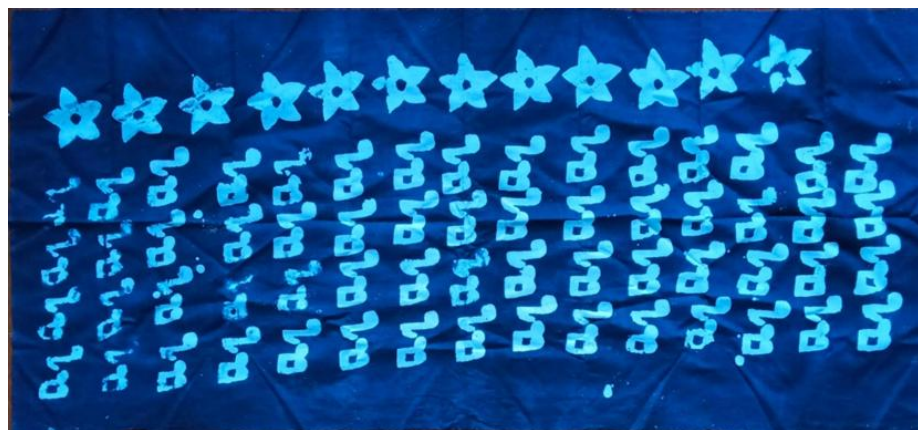
Gambar 2. Gambar bunga nada