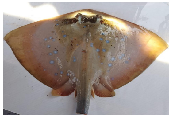
Gambar 5. Pari Ekor Pendek