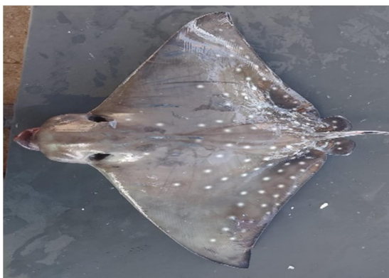
Gambar 4. Pari Elang