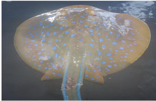
Gambar 2. Pari totol biru

Berikut ini merupakan 4 jenis pari yang diperdagangkan di Pasar Oesapa yaitu: