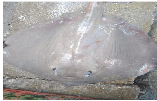
Gambar 3. Pari ekor lembu