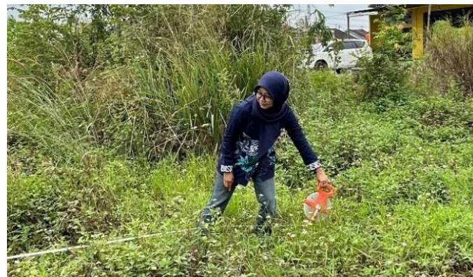
Gambar 3. Pengukuran Lahan

Penyusunan DED dilakukan dalam bentuk gambar teknik lengkap menggunakan software Autocad versi 2025 dan dokumen pendukung. Dokumen yang disusun meliputi: