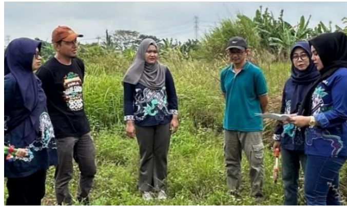
Gambar 2. Koordinasi Kebutuhan Ruang