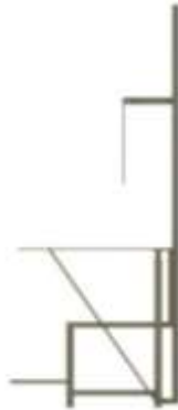
Gambar 2 Rancang Bangun Desain 2D

Tahapan selanjutnya dari perancangan adalah pembuatan desain Kursi Anthropometri dengan software AutoCAD untuk mendapatkan bentuk yang diinginkan.