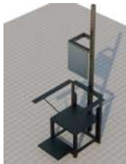
Gambar 3 Rancang Bangun Desain 3D

Hasil pengolahan data dimensi tubuh selanjutnya digunakan sebagai acuan dalam ukuran pembuatan Kursi Anthropometri.