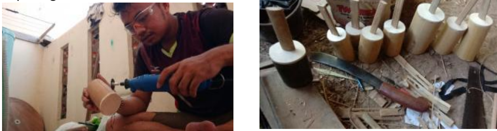
Gambar 13: Proses eksperimentasi kolbam.

Proses eksperimentasi yang dilakukan penulis dalam pembuatan kolbam memakan waktu sekitar satu bulan. Waktu yang lama ini dibutuhkan karena penulis mengalami berbagai kendala dan kegagalan terutama untuk mendapatkan solusi bagaimana caranya bambu ini bisa menghasilkan warna suara dari rongga bambu. Setelah hasil eksperimen yang panjang akhirnya kolbam bisa menghasilkan warna suara dengan bahan yaitu kayu dowel , karet dan sabuk. Keberhasilan proses eksperimen ini sangat didukung oleh proses diskusi dan pengetahuan yang didapat penulis terutama tentang prinsip dasar organologi dalam konteks mekanisme bunyi. Sehingga dapat disimpulkan bahwa bentuk kolbam menyerupai tabung yang berprinsip semakin besar rongga bambu semakin rendah nada dan suara yang dihasilkan, begitupun sebaliknya. Adapun bagaimana proses penulis dalam melakukan proses eksperimentasi dapat dilihat pada gambar berikut.