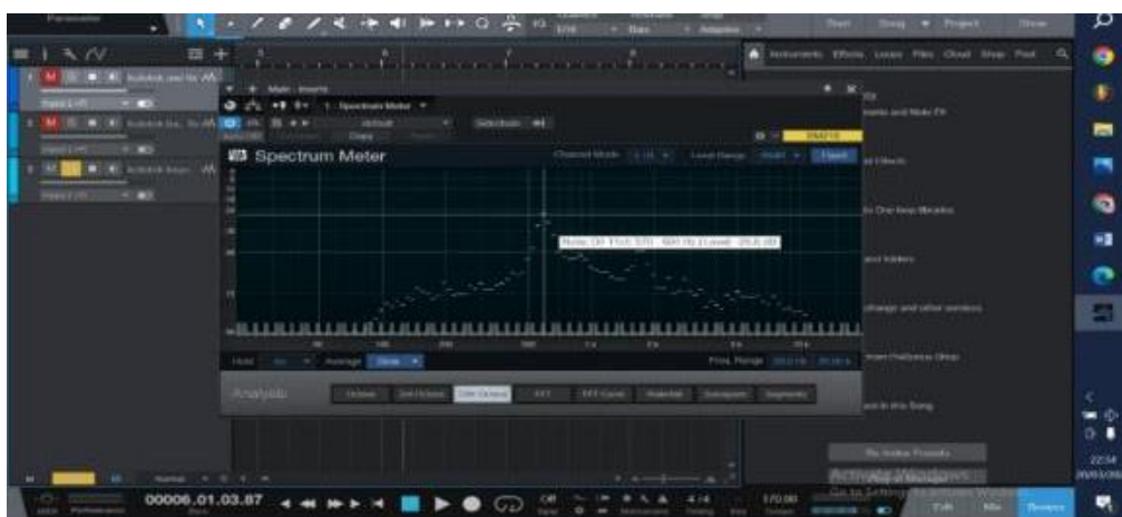
Gambar 10: Hasil analisis pengukuran suara kolbam (Transkrip : studio one 5 Farhan Setiawan, 2024)

Untuk menempuh tahap analisis yang sama dengan dua jenis kolotok tradisional lain, penulis juga melakukan analisis timbre suara melalui uji coba menggunakan studio one 5 . Berdasarkan hasil analisis diketahui bahwa Kolbam memiliki frekuensi fundamental 570-604 Hz level 20,9 dB yang secara lebih rinci dapat dilihat pada gambar berikut.