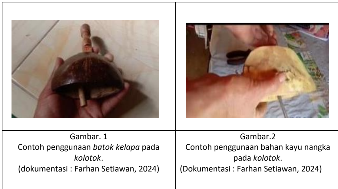
Tabel 2: Tabel kolotok batok dan kolotok kayu