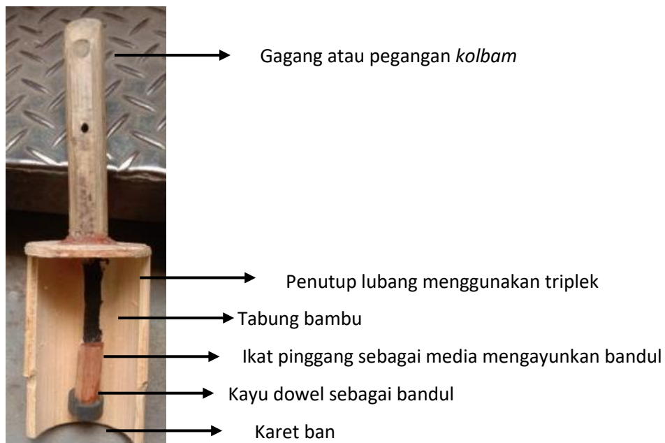
Gambar 9: Struktur organologi kolbam

Untuk menempuh tahap analisis yang sama dengan dua jenis kolotok tradisional lain, penulis juga melakukan analisis timbre suara melalui uji coba menggunakan studio one 5 . Berdasarkan hasil analisis diketahui bahwa Kolbam memiliki frekuensi fundamental 570-604 Hz level 20,9 dB yang secara lebih rinci dapat dilihat pada gambar berikut.