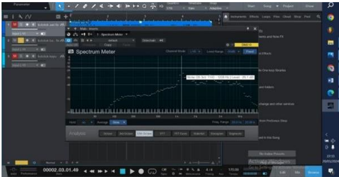
Gambar 8: Analisis pengukuran suara kolotok batok (Transkrip : Studio one 5 Farhan Setiawan, 2024)

Dengan menggunakan treatment yang sama penulis juga menganalisis timbre suara yang dihasilkan oleh kolotok batok melalui uji coba menggunakan studio one 5 . Berdasarkan analisis diketahui bahwa kolotok batok menghasilkan frekuensi fundamental 1140-1208 Hz level 20,1 dB yang dapat dilihat pada gambar yang terdapat di bawah ini :