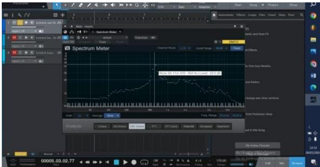
Gambar 5: Analisis pengukuran suara kolotok kayu (Transkrip: studio one 5 Farhan Setiawan, 2024)

Namun demikian, untuk analisis lebih dalam tentang unsur musikal lain yang merujuk pada pendapat Suharto (2007) menekankan pentingnya mengukur frekuensi dan intensitas suara untuk memastikan karakter bunyi instrumen sesuai tujuan komposisi, penulis juga melakukan uji coba menggunakan aplikasi studio one 5 untuk menganalisis frekuensi bunyi yang dihasilkan oleh kolotok kayu . Berdasarkan hasil analisis, diketahui bahwa kolotok kayu yang dipilih penulis memiliki frekuensi fundamental 570-600 Hz level 26,6 dB. Adapun hasil analisis pada studio one 5 yang penulis lakukan dapat dilihat pada gambar di bawah ini.