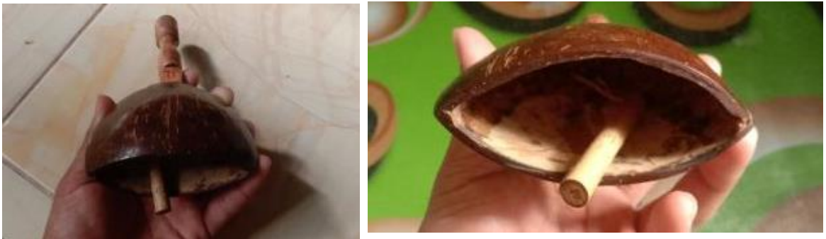
Gambar 6: Kolotok batok

Berdasarkan fungsinya kolotok batok memiliki fungsi yang sama seperti kolotok kayu , namun berbeda dari segi bahan dan suara yang dihasilkan. Berdasarkan hasil wawancara dan observasi yang dilakukan pada salah seorang petani di Desa Cijeungjing bernama Mang Akung disebutkan bahwa jenis kolotok ini dibuat dengan menggunakan bahan utama batok kelapa. Secara lebih detail, Mang Akung juga menyebut bahwa batok yang digunakan harus kering dan bersih dari serat kelapa. Adapun pemilihan jenis bahan tersebut didasarkan pada pertimbangan kebutuhan bunyi yang nyaring dan keras. Sehingga saat bergetar dan beradu dengan bambu, kolotok batok dapat menghasilkan bunyi yang nyaring. Untuk dapat melihat lebih jelas bagaimana bentuk jenis kolotok batok , perhatikan gambar di bawah ini.