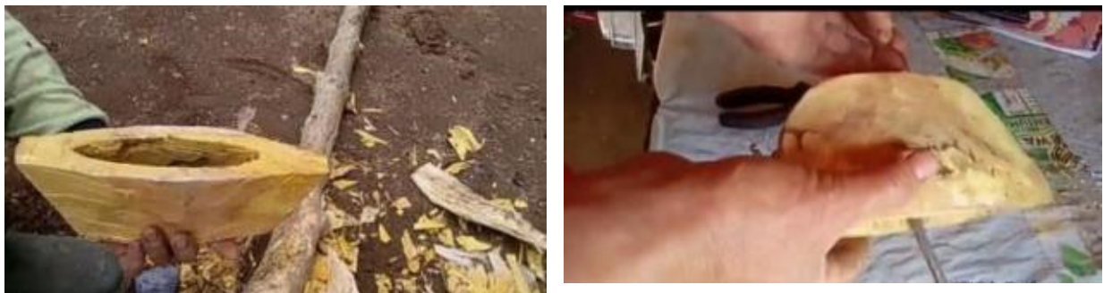
Gambar 3: Kolotok kayu

Kolotok kayu biasanya berbahan dasar kayu nangka pemilihan kayu nangka ini berdasarkan kekuatan kayu yang awet dan tahan lama serta mudah dibentuk menjadi kolotok . Mang Dira selaku petani di Desa Sadananya menggunakan kolotok dari kayu nangka ini, penggunaan kolotok kayu agar bisa menghasilkan suara dibantu dengan besi sehingga dapat menghasilkan timbre suara kolotok kayu .