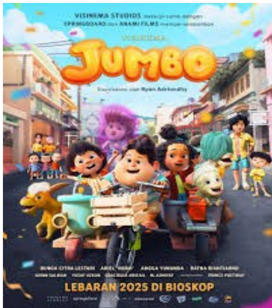
Gambar 2. Flyer Film Animasi Jumbo, Sumber: Instagram Visinema Studios

Penelitian Pendidikan dan Kesehatan yang relevan tentang bertambahnya pemahaman anak dalam konsep dan pengetahuan yang harus dimengerti, diungkapkan oleh Mohammadhosseini dkk, bahwa film animasi bahkan lebih efektif dibandingkan dengan mendongeng 35 .