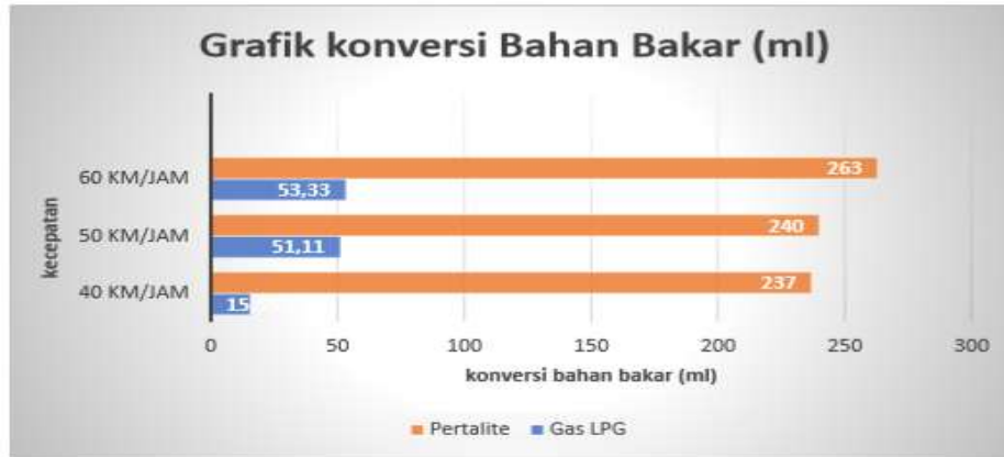
Gambar 3.1. Grafik Perbandingan kecepatan dan konsumsi bahan bakar dalam Mililiter