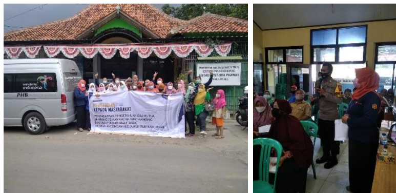
Gambar 1. Pelaksanaan kegiatan pengabdian