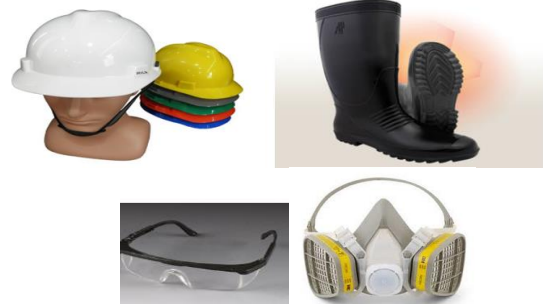
Gambar 1. Alat Pelindung Diri

Penggunaan Alat pelindung Diri yang standar sangat diperlukan , karena banyak kasus dimana pekerja yang sudah memakai Alat Pelindung Diri masih bisa terkena celaka karena penggunaan Pelindung yang tidak standar.