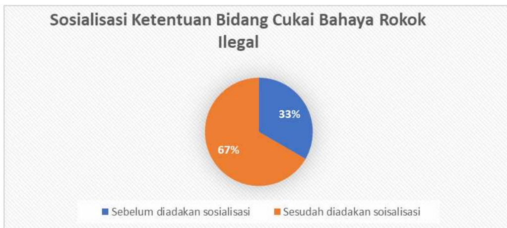
Gambar 7. Persentase Sosialisasi Ketentuan Bidang Cukai Bahaya Rokok Ilegal

Berdasarkan data dalam sosialisasi ini, tingkat pengetahuan masyarakat se-kecamatan moga sebelum dilaksanakannya sosialisasi pada gambar 7 yaitu hanya mencapai 33%. Sedangkan dari hasil survei tingkat ke pemahaman masyarakat se-kecamatan moga yaitu 67 % dari pemateri sangat memahami materinya dan memberikan edukasi awal untuk lebih skeptis dalam penanggulangan rokok ilegal.