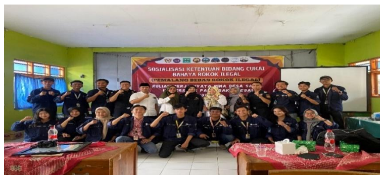
Gambar 6. Sosialisasi Ketentuan Bidang Cukai Bahaya Rokok Ilegal

Secara umum, tugas bea cukai meliputi, Memastikan bahwa barang-barang yang masuk dan keluar negara memenuhi peraturan dan undang-undang yang berlaku, Mengumpulkan bea masuk, pajak impor, dan pajak ekspor, Mencegah penyelundupan dan perdagangan barang ilegal, Mengelola proses kepabeanan dan memberikan izin impor dan ekspor. Kegiatan ini penting untuk menjaga kestabilan ekonomi dan keamanan suatu negara, serta memastikan bahwa perdagangan internasional berlangsung sesuai dengan peraturan yang berlaku. Tujuan sosialisasi bea cukai adalah untuk memberikan pemahaman kepada masyarakat tentang penggunaan cukai dan barang kena cukai, Memberikan informasi kepada masyarakat tentang penggunaan cukai rokok ilegal yang merugikan negara, Meminimalisir peredaran rokok ilegal, Mengajarkan ciri-ciri rokok ilegal, seperti rokok tanpa pita cukai, rokok dengan pita cukai bekas, dan rokok dengan pita cukai palsu.