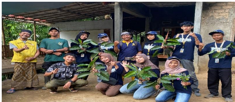
Gambar 1. Penanaman Bibit Pohon Karet

Hasil dari kegiatan ini adalah tumbuhnya kembali vegetasi hutan yang berfungsi sebagai penyimpan air dan penyaring alami, Pemulihan area kritis yang sebelumnya mengalami degradasi, sehingga meningkatkan kualitas lingkungan sekitar, Meningkatnya kuantitas dan kualitas sumber mata air di daerah reboisasi, Terjalannya kerja sama antara pemerintah, masyarakat, dan organisasi lingkungan dalam menjaga kelestarian hutan.