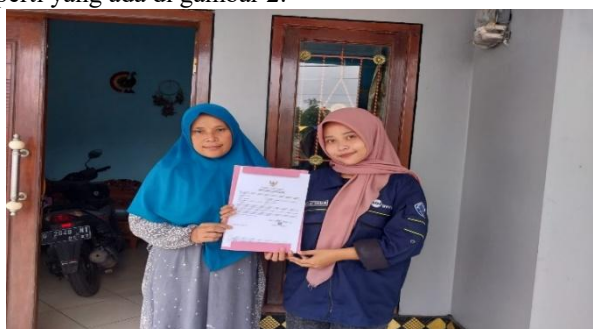
Gambar 2. Pendampingan dan Penyerahan Legalitas Ijin Usaha UMKM

Pendampingan legalitas izin usaha untuk produk UMKM (Usaha Mikro, Kecil, dan Menengah), terutama dalam hal Nomor Induk Berusaha (NIB), adalah proses dukungan dan bimbingan yang diberikan kepada pelaku UMKM untuk memperoleh dan mengelola izin usaha yang sah. Kami telah membantu mendata UMKM di Desa Plakaran, di mana sebanyak 22 pelaku usaha telah didaftarkan dan NIB mereka sudah selesai serta telah didistribusikan kepada pelaku usaha di desa tersebut. Kami juga bekerja sama dengan Dinas Bappeda dan Diskoperindag dalam proses ini. Tujuan dari program kerja pengembangan UMKM melalui Digital Marketing yaitu untuk Membantu UMKM memenuhi semua persyaratan hukum yang berlaku agar usaha mereka sah dan terhindar dari masalah hukum di masa depan, Meningkatkan kredibilitas dan legitimasi usaha UMKM di mata pelanggan dan mitra bisnis melalui kepemilikan NIB, Mempermudah akses UMKM ke fasilitas dan dukungan pemerintah, termasuk pembiayaan, bantuan teknis, dan program pengembangan usaha seperti yang ada di gambar 2.