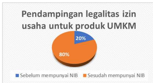
Gambar 3. Persentase Pendampingan legalitas izin usaha untuk produk umkm