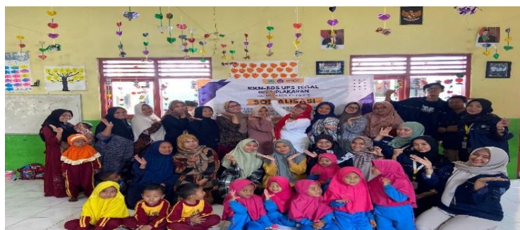
Gambar 4. Sosialisasi Pencegahan stunting

Kegiatan ini diikuti oleh ibu hamil dan ibu yang memiliki anak balita. Stunting merupakan masalah tumbuh kembang pada anak yang mengakibatkan tinggi badan rendah. Kabar baiknya, stunting dapat dicegah sejak dini, termasuk pada masa kehamilan. Upaya pencegahan stunting dapat dimulai sejak masa kehamilan dan berlanjut hingga anak berusia dua tahun, yaitu masa 1000 hari pertama kehidupan. Beberapa upaya pencegahan yang dapat dilakukan antara lain: memperhatikan asupan gizi, melakukan pemeriksaan kesehatan rutin pada ibu hamil dan balita, menangani permasalahan anak yang sulit makan beraneka ragam jenis makanan, menjaga kebersihan lingkungan, memberikan edukasi dan konseling kepada ibu hamil dan ibu menyusui, serta memberikan seluruh vaksinasi yang dianjurkan. Tujuan dari sosialisasi ini adalah untuk memberikan informasi tentang pencegahan stunting , meningkatkan kesadaran masyarakat, dan mendorong perubahan perilaku yang mendukung kehidupan masyarakat yang sehat. Kegiatan Sosialisasi Stunting ini diharapkan dapat memberikan beberapa hasil, antara lain peningkatan pengetahuan tentang makanan sehat dan bergizi pada ibu-ibu yang sehari-hari menyediakan makanan untuk anak, kemampuan memberikan perhatian dan gizi lebih kepada anak, serta penerapan pola hidup bersih dan sehat dalam rangka mewujudkan sumber daya manusia yang berkualitas, seperti yang ditunjukkan pada Gambar 4.