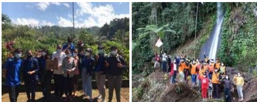
Gambar 4. Pembuatan Video Profil Desa Sanda dan Upacara Untuk Memperingati Hari Kemerdekaan ke-76 th

Program Memperkenalkan Keindahan dan Keunikan yang Dimiliki Oleh Desa Sanda di Tengah Pandemi Covid-19 Melalui Video Profil Desa tujuannya untuk membantu memperkenalkan potensi dan keunikan yang dimiliki oleh Desa Sanda di tengah pandemi Covid-19, sehingga dikenal oleh masyarakat luas yang tidak dapat berkunjung saat pandemi berlangsung. Bentuk dari kegiatan video profil ini dilakukan dengan cara mengunjungi tempat-tempat yang memiliki keunikan dan keindahan di wilayah Desa Sanda dan melakukan shooting di tempat tersebut.