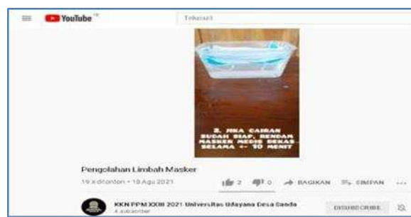
Gambar 1. Video Edukasi Pengolahan Limbah Masker

Kegiatan ini dilaksanakan secara daring melalui media Whatsapp Group yang di dalamnya telah tergabung beberapa warga Desa Sanda. Kegiatan penyuluhan dilakukan dengan membuat dan menyebarkan video demonstrasi melalui platform Youtube ke dalam 2 buah Whatsapp Group (WAG) yaitu WAG STT Banjar Sekar Sandat dengan peserta 33 orang dan WAG Edukasi Kesehatan KKN yang kami bentuk dengan peserta 31 orang. Video demonstrasi berisikan informasi tentang cara penanganan sampah masker medis berdasarkan panduan dari Kemenkes RI tahun 2021. Kegiatan penyuluhan dilaksanakan secara daring pada tanggal 15 Agustus 2021. Monitoring kegiatan dilakukan dengan memantau jumlah reader di WAG serta jumlah viewer video edukasi di youtube yang mana menggunakan akun youtube KKN Sanda A dan B. Kegiatan dievaluasi melalui sesi tanya jawab yang diadakan bagi peserta. Kendala yang dialami sama dengan kegiatan sebelumnya karena pelaksanaannya pada hari yang sama, yaitu sedikitnya peserta yang bergabung ke dalam Google Meet , sehingga kegiatan dialihkan ke WAG dengan membagikan link video edukasi. Video edukasi dapat diakses melalui link berikut: https://www.youtube.com/watch?v=QgiWu1zJ7eA