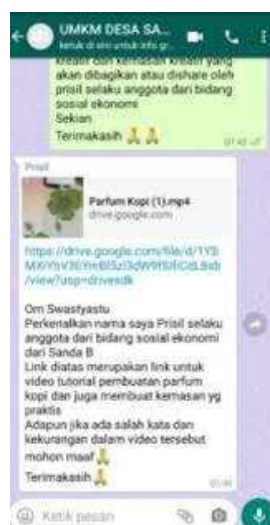
Gambar 3. Dokumentasi Video di Whatsapp Grup UMKM Desa Sanda

Adapun kegiatan dari Program Edukasi dan Pelatihan Pengolahan dan Pengemasan Produk Kreatif adalah pembuatan parfum kopi dan pembuatan kemasan produk-produk dari UMKM di antaranya kemasan kripik tela rambut, kemasan kripik singkong, kemasan kripik talas atau lanjang, kemasan kripik pisang, kemasan gula semut. Video edukasi dan pelatihan pengolahan dan pengemasan produk kreatif di bagikan di Whatsapp Grup UMKM Desa Sanda pada Rabu, 18 Agustus 2021.