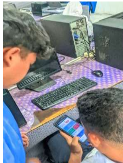
Gambar 3. Siswa Mencoba aplikasi MySaku Di Smartphone masing-masing

Pemanfaatan aplikasi ini membantu siswa memvisualisasikan pola pengeluaran mereka secara lebih jelas, sehingga mendorong sikap lebih bijak dalam menggunakan uang saku. Hasil ini sejalan dengan temuan penelitian sebelumnya yang menyatakan bahwa penggunaan aplikasi keuangan berbasis web dapat meningkatkan kesadaran dan kedisiplinan dalam mengelola keuangan pribadi. Melalui aplikasi MySaku, siswa tidak hanya berperan sebagai pengguna teknologi, tetapi juga sebagai individu yang mulai membangun kebiasaan finansial yang lebih terencana.