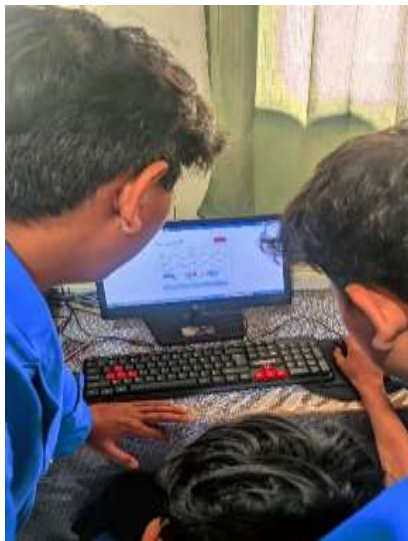
Gambar 2. Siswa Mencoba aplikasi MySaku Di Komputer masing-masing.

Selain peningkatan pemahaman konseptual, seluruh peserta kegiatan berhasil menggunakan aplikasi web MySaku sebagai media pencatatan keuangan secara mandiri. Siswa mampu memasukkan data pemasukan dan pengeluaran uang saku melalui perangkat masing-masing dengan bimbingan tim Pengabdian kepada Masyarakat. Aplikasi MySaku berfungsi sebagai media pencatatan keuangan yang sederhana, terstruktur, dan mudah diakses oleh siswa.