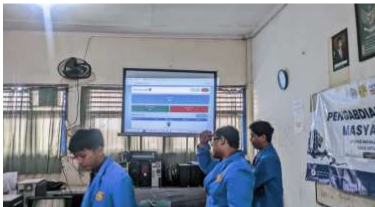
Gambar 1. Penjelasan Materi Oleh Tim PkM

Hasil pelaksanaan kegiatan Pengabdian kepada Masyarakat menunjukkan adanya peningkatan pemahaman siswa terkait konsep literasi keuangan, khususnya dalam pengelolaan uang saku. Berdasarkan hasil observasi dan evaluasi selama kegiatan berlangsung, siswa menunjukkan peningkatan pemahaman yang signifikan mengenai pentingnya pencatatan pemasukan dan pengeluaran, serta kemampuan membedakan antara kebutuhan dan keinginan setelah mengikuti kegiatan edukasi dan praktik penggunaan aplikasi MySaku.