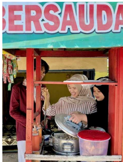
Gambar 3. Pembuatan konten untuk Media Promosi

Pelatihan dan Pendampingan Rutin Setiap minggu dilakukan sesi pelatihan mini dan evaluasi. Pemilik dilatih untuk membaca statistik insight media sosial, memahami waktu posting yang efektif, mengelola ulasan pelanggan, dan membuat promosi digital seperti giveaway atau diskon musiman.