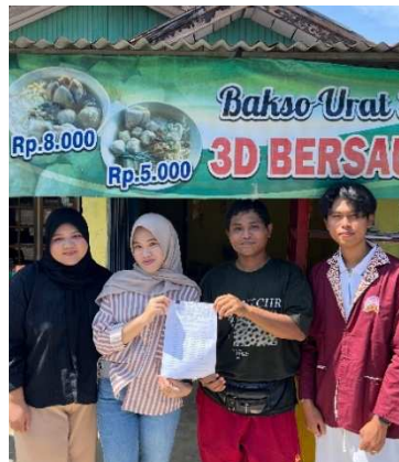
Gambar 1. Kunjungan Ke Warung Bakso Urat Sapi 3D Bersaudara

Proses pendampingan Observasi dan Menganalisis Situasi di Warung Bakso Urat 3D Bersaudara Tim pendamping melakukan observasi langsung ke lokasi usaha di Jln timur indah 5 Rt 32 No 15, Sido Mulyo, Kec. Gading Cemp., Kota Bengkulu, Bengkulu 38229 dan melakukan wawancara mendalam dengan pemilik tempat bakso. Dari hasil analisis SWOT, ditemukan bahwa kekuatan utama terletak pada cita rasa produk dan loyalitas pelanggan lama, sementara kelemahan utama adalah ketidaktahuan terhadap media digital dan keterbatasan SDM dalam pengelolaan konten digital. Gambar 1. Menunjukkan proses Kunjungan pada UMKM bertujuan untuk dapat mengetahui kondisi secara aktual usaha pelaku UMKM, masalah yang dihadapi, dan harapan pengembangan usaha yang dimiliki. Sehingga, pendamping memiliki gambaran berupa arah pengembangan, perencanaan dan pelaksanaan di lapangan secara terperinci.