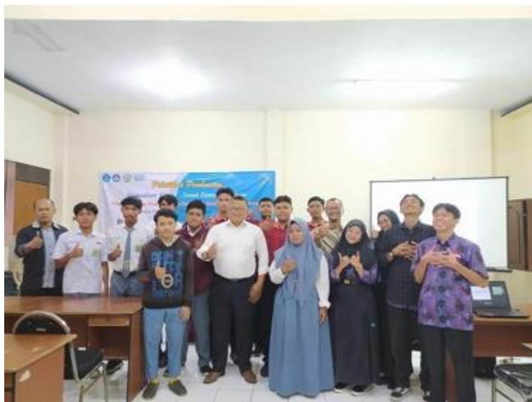
Gambar 7. Peserta Kegiatan dan Pemateri

Peserta yang hadir sangat bersemangat dan antusias dengan penyampaian materi oleh narasumber yang berjalan dengan sangat interaktif. Para peserta juga banyak melontarkan pertanyaan seputar CV maupun dunia kerja. Mereka mendapat tidak hanya pelatihan pembuatan CV tetapi juga insight mengenai dunia pekerjaan. Selesai pematerian dan praktek penyusunan CV berbasis ATS, acara langsung dilanjutkan menuju kegiatan Q&A, kuis, dan sampai di penghujung acara dan ditutup langsung dengan kegiatan foto bersama. Foto bersama dapat dilihat pada gambar 7;