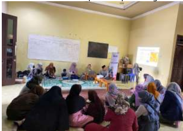
Gambar 2. Kegiatan diskusi terkait potensi recycle minyak jelantah

Kegiatan awal pengabdian ini diawali dengan pendidikan kepada Kelompok Ibu Bisa Lampung Terkait Produk Recycle dari minyak jelantah (Gambar 2). Pada kegiatan ini anggota kelompok Ibu Bisa Lampung diberikan edukasi terkait beberapa produk yang berasal dari minyak jelantah, seperti lilin, sabun batang, biodiesel, serta dapat membantu mengurangi resiko pencemaran lingkungan (Andalia & Pratiwi, 2018; Isna & Ritma Dhanti, 2021; Prihanto & Irawan, 2018). Selain diskusi terkait produk-produk yang dapat dibuat dari minyak jelantah, pada kesempatan kali ini para anggota kelompok diminta mengumpulkan minyak jelantah yang ada dirumah. Minyak jelantah yang terkumpul nantinya akan dilakukan recycle pada kegiatan Pelatihan Recycle Minyak Jelantah Sebagai Bahan Baku Pembuatan Produk Sabun Batangan. Pada akhir kegiatan ini anggota kelompok Ibu Bisa Lampung diminta mengisi kuisioner terkait pengetahuan awal peserta sebelum dilakukan praktek pada kegiatan selanjutnya.