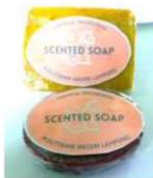
Gambar 4. Produk sabun batang hasil recycle minyak jelantah yang sudah dikemas

Selain praktek recycle minyak jelantah menjadi sabun batang, para peserta pelatihan juga diajarkan untuk pengemasan sabun batang yang sudah mengeras (Gambar 4). Dengan adanya tahap pengemasan ini, diharapkan dapat memotivasi peserta pelatihan untuk dapat melanjutkan produk sabun batang menjadi produk yang bernilai ekonomi. Sehingga selain penanggulangan limbah minyak jelantah dapat pula sebagai potensi wirausaha. Sabun batang dari minyak jelantah memiliki potensi untuk dijadikan produk home industry. Home industry adalah usaha rumahan yang dilakukan dengan memanfaatkan waktu luang, sehingga tidak terikat tempat dan waktu. Sehingga dengan adanya kegiatan ini dapat menciptakan suatu kegiatan wirausaha dan memberikan penghasilan tambahan bagi pelaku usaha untuk dapat menuju kehidupan yang lebih sejahtera secara material (Humaini, 2018).