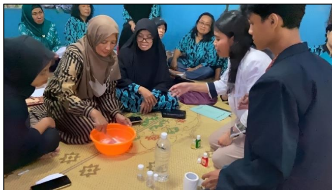
Gambar 3. Tahapan Praktik Pembuatan Cymbosavon.

tercampur merata. Pewarna dan pengawet dimasukkan terakhir dengan penekanan pada penggunaan bahan-bahan alami dan aman untuk kulit. Setelah campuran merata, larutan didiamkan sejenak untuk memastikan kestabilan emulsi dan menghindari endapan. Sabun cair yang sudah jadi, kemudian dituangkan ke dalam botol transparan, diberi label nama produk Cymbosavon, dan dikemas secara higienis. Semua tahapan ini dilakukan dengan pendekatan praktik langsung, sehingga peserta mampu menguasai keterampilan secara mandiri dan dapat mempraktikkan kembali proses tersebut di rumah sebagai upaya berkelanjutan (Hutapea & Sembiring, 2021). Proses Tahapan Praktik Pembuatan Cymbosavon ditunjukkan pada Gambar 3.