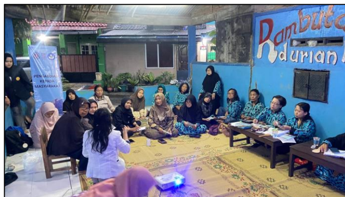
Gambar 4. Tahapan Teknik Pengemasan Produk Cymbosavon.

Tahapan ketiga yaitu tahapan teknik pengemasan produk Cymbosavon merupakan langkah penting dalam menjaga kualitas produk dan meningkatkan daya tarik konsumen (Gambar 4). Dalam pelatihan, peserta diajarkan untuk memilih wadah yang tepat, seperti botol plastik transparan ukuran 100 ml yang tahan terhadap bahan kimia ringan dan mudah digunakan. Proses pengisian sabun dilakukan menggunakan corong agar tidak tumpah, kemudian botol ditutup rapat menggunakan tutup flip-top agar higienis dan praktis. Setelah botol ditutup rapat, setiap botol diperiksa secara visual untuk memastikan tidak ada kebocoran atau kotoran pada bagian luar maupun tutupnya. Peserta juga dikenalkan cara membuat label sederhana yang mencantumkan nama produk, komposisi, tanggal produksi, dan kontak produsen.