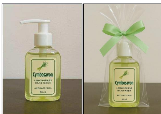
Gambar 1. Produk Cymbosavon.

Pelatihan pembuatan Cymbosavon yang dilaksanakan di Desa Wonorejo mendapat respon positif dari masyarakat. Sebanyak 25 peserta hadir secara aktif selama kegiatan berlangsung yang terdiri dari ibu-ibu PKK Desa Wonorejo. Dalam pelatihan ini, peserta mendapatkan materi tentang pemanfaatan serai wangi sebagai bahan alami produk sabun cair, teknik pembuatan produk, dan wawasan dasar berwirausaha. Melalui praktik langsung, peserta menunjukkan kemampuan yang cukup baik dalam memproduksi sabun cair. Produk Cymbosavon ditunjukkan pada Gambar 1. Evaluasi produk menunjukkan bahwa hasil akhir memiliki karakteristik fisik yang memenuhi standar, yaitu harum, berwarna menarik, dan bertekstur lembut.