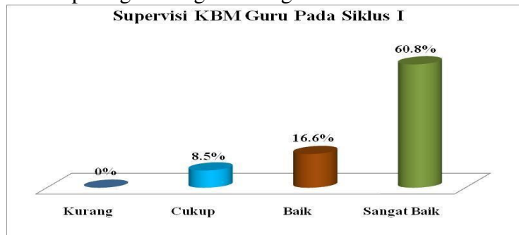
Grafik Diagram Tabung 2: Supervisi KBM Guru Pada Siklus I

Untuk lebih jelasnya dapat dilihat pada gambar/grafik diagram berikut ini.