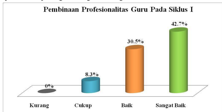
Grafik Diagram Tabung 4 : Pembinaan Profesionalitas Guru Pada Siklus I

Untuk lebih jelasnya dapat dilihat pada gambar/grafik diagram berikut ini.