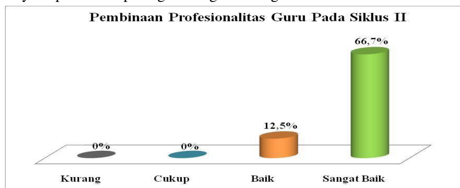
Grafik Diagram Tabung 8 : Pembinaan Profesionalitas Guru Pada Siklus II

Untuk lebih jelasnya dapat dilihat pada gambar/grafik diagram berikut ini.