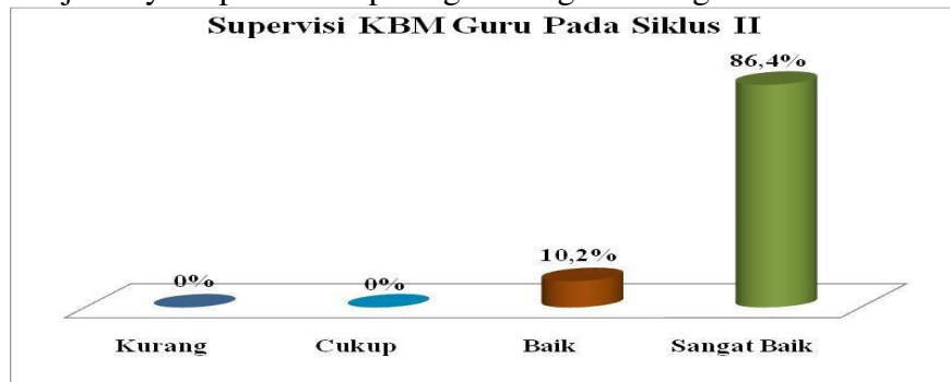
Grafik Diagram Tabung 6 : Supervisi KBM Guru Pada Siklus II

Untuk lebih jelasnya dapat dilihat pada gambar/grafik diagram berikut ini