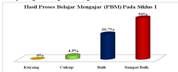
Grafik Diagram Tabung 3 : Hasil Proses Belajar Mengajar Pada Siklus I

Untuk lebih jelasnya dapat dilihat pada gambar/grafik diagram berikut ini.