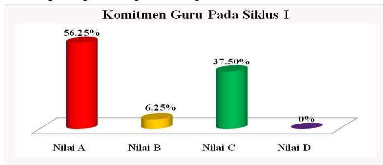
Grafik Diagram Tabung 1 : Komitmen Guru Pada Siklus I

Untuk lebih jelasnya dapat dilihat pada gambar/grafik diagram berikut ini.