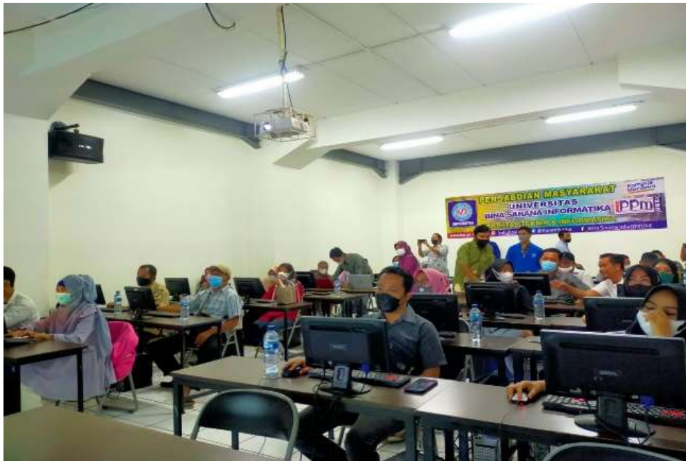
Gambar 6. Proses pelaksanaan pelatihan pada pengabdian masyarakat