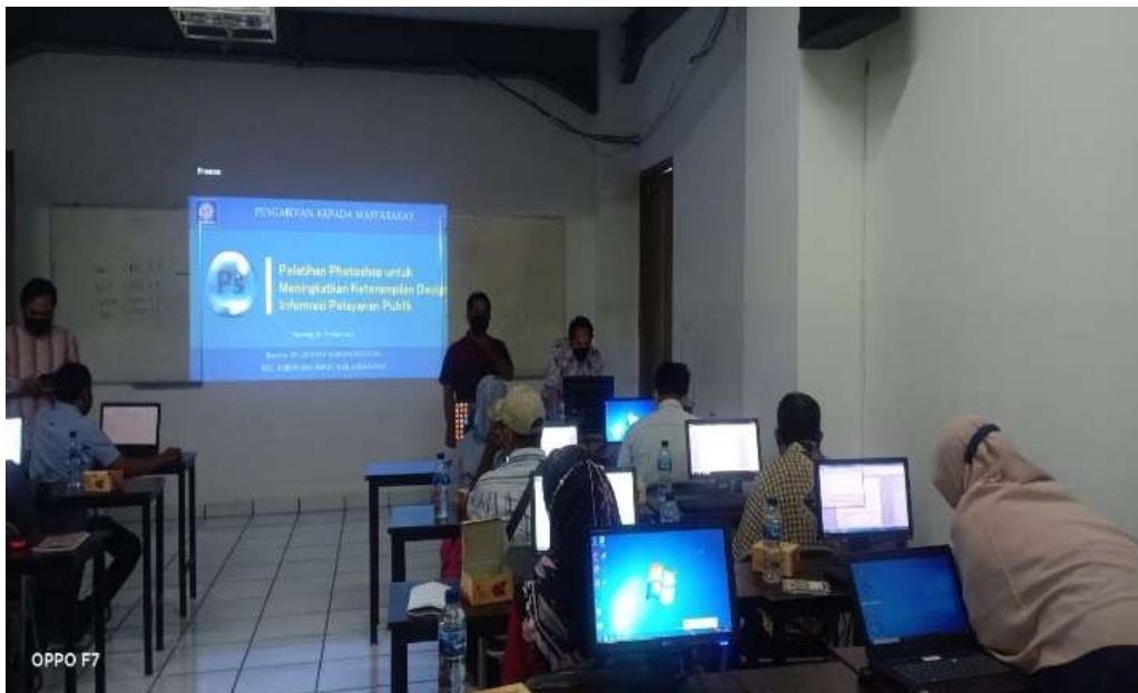
Gambar 5. Proses pelaksanaan pelatihan pada pengabdian masyarakat

Dari diagram pada gambar 2 merupakan hasil respon peserta pengabdian masyarakat yang di isi melalui kuesioner pada akhir kegiatan pada poin pertanyaan P7 yang di ketahui bahwa adanya kegiatan pengabdian masyarakat ini bermanfaat dan menambah wawasan serta keterampilan para warga dan staf kelurahan dalam membuat dan mendesain poster ataupun spanduk sebagai media informasi kepada warga di lingkungannya.