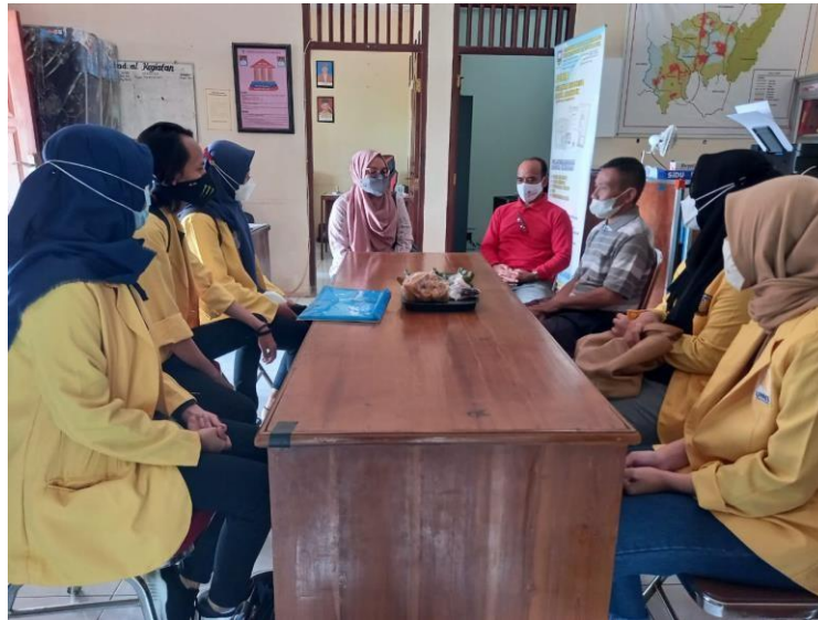
Gambar 3. Pendampingan Bumdes Untung Makmur Desa Branjang

Partisipasi mitra dalam pelaksanaan pengabdian masyarakat pelatihan pemasaran online di Desa Branjang Kecamatan Ungaran Barat Kabupaten Semarang adalah sebagai peserta program (penerima manfaat program), menyiapkan tempat pelaksanaan program, menjamin terselenggaranya kesinambungan pelaksanaan program, mulai dari penilaian sampai dengan implementasi pelatihan dan pendampingan kelompok.