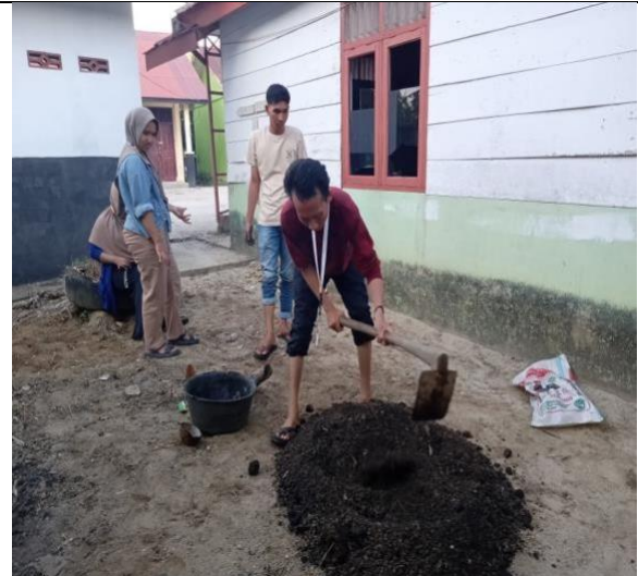
Gambar 3 Proses Pembuatan Media Tanam