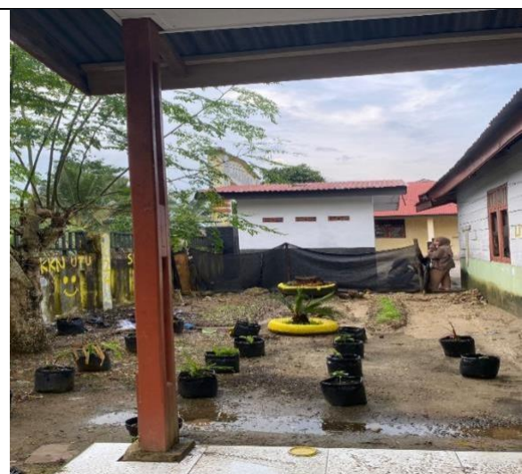
Gambar 5 Pekarangan Kantor Desa Lae Butar

Tanaman obat keluarga lebih baik dari pada obat-obatan sintentik atau obat dari