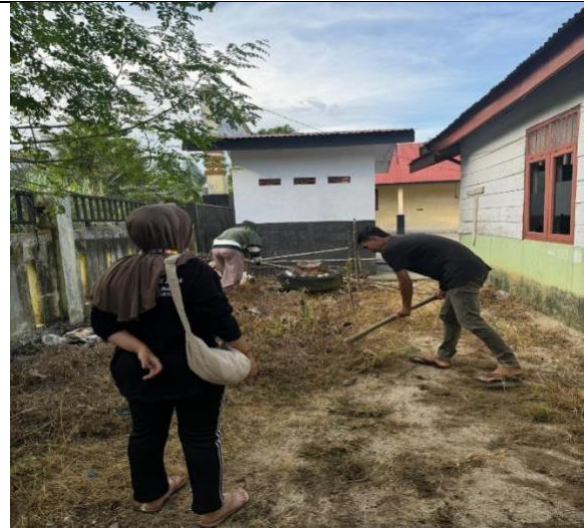
Gambar 2 Proses Pembersihan Lahan