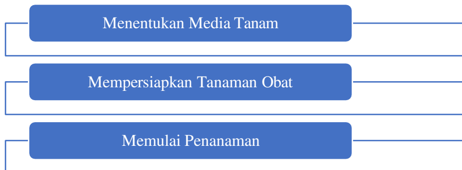
Gambar 1 Bagan Alir Proses Penanaman TOGA

Penelitian ini dilakukan di pekarangan Kantor Desa Lae Butar Kecamatan Gunung Meriah Kabupaten Aceh Singkil. Pemilihan Kantor Desa sebagai lokasi penelitian didasarkan pada pertimbangan bahwa agar masyarakat dapat melihat secara keseluruhan tanaman obat yang akan ditanam. Waktu pelaksanaan penelitian pada bulan Agustus 2024. Data yang digunakan dalam penelitian ini berupa data tentang jenis-jenis tanaman obat keluarga dan proses penanamannya. Adapun tahapan penanaman TOGA dapat dilihat pada Gambar 1.