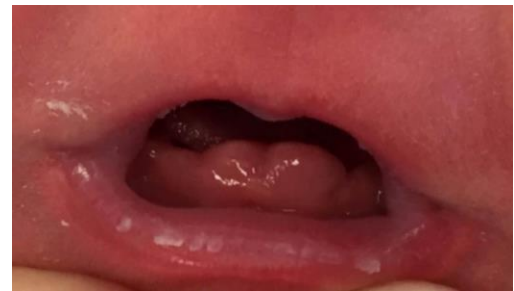
Gambar 1. Bayi perempuan berusia dua hari dengan gigi natal. 3

Gigi natal dan gigi neonatal dibedakan dari waktu munculnya gigi tersebut. 5 Gigi natal adalah gigi yang muncul saat lahir, dan gigi neonatal adalah gigi yang tumbuh pada 30 hari pertama setelah lahir. Gigi ini juga disebut sebagai “gigi bawaan”, “gigi sulung janin”. 1,4,5,6