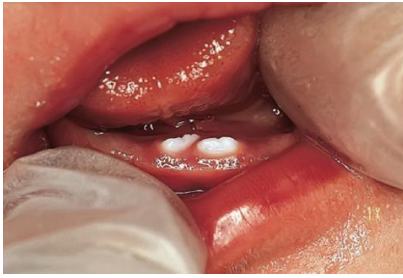
Gambar 3. Gigi natal pada bayi perempuan berusia 2 hari. 7