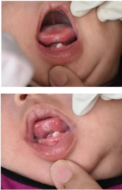
Gambar 5. Ulserasi pada ventral lidah (Riga Fide Disease) pada bayi berusia 1 bulan. 4

karies, polip pulpa, atau erupsi dini gigi penerus. 3,4,7