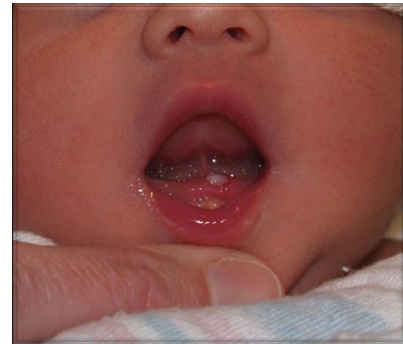
Gambar 2. Gigi natal pada bayi berusia 3 bulan. 5