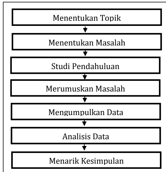
Gambar 2. Langkah Penelitian

Pada Gambar 2, menjelaskan langkah-langkah dalam penelitian, langkah pertama menentukan topik masalah yang akan diteliti. Kemudian menentukan masalah yang akan dipecahkan. Dalam studi pendahuluan diawali dengan mengidentifikasi terjadinya gejala- permasalahan dalam penelitian. Rumusan masalah yang akan dibahas pada penelitian ini adalah