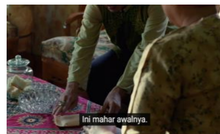
Gambar 15 : scene 43 mang Dodi datang melamar Yuni

Pada menit 53:33-52:32. Saat siang hari Yuni dan Tika duduk bersantai sambil mewarnai kuku diteras rumah Yuni, mereka membicarakan Ahmad suami Tika yang belum pernah pulang kerumah Tika semenjak dia melahirkan, Tika dan suaminya tinggal di rumah orang tua masing-masing. Ahmad tidak ingin tinggal dirumah orang tua Tika karena tidak betah. Namun, ketika Tika ingin ikut Ahmad, kedua orang tua suaminya mengatakan sibuk dan kerepotan membantu mengurus bayi. Ketika tengah asik bercerita Yuni dan Tika mendengar suara dari kejauhan sedang mencari rumah Yuni, mereka pun sedikit bingung.