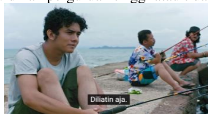
Gambar 8 : scene 15 Yuni berkumpul bersama temannya di tepi pantai

Pada durasi 1:48:42-1:46:44. Yuni mencuci bajunya sambil melakukan video call atau panggilan video bersama ibunya yang berada di luar kota, Yuni memberitahukan bahwa ibu Lies yang ingin bertemu dan membicarakan perihal sekolah Yuni apakah ingin lanjut ke jenjang pendidikan perguruan tinggi atau tidak.