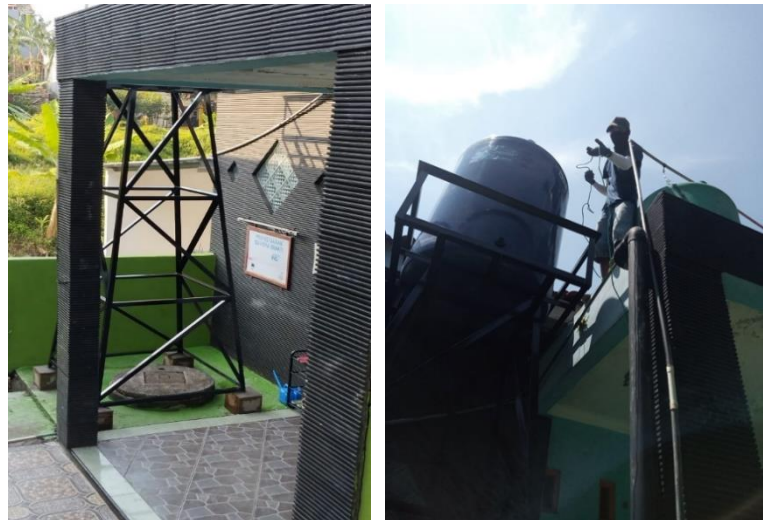
Gambar 3. Penambahan Tandon