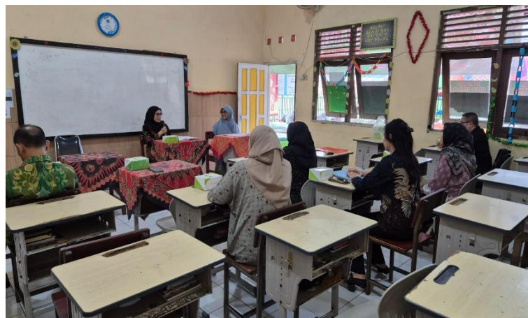
Gambar 4. Sosialisasi dan Pelatihan