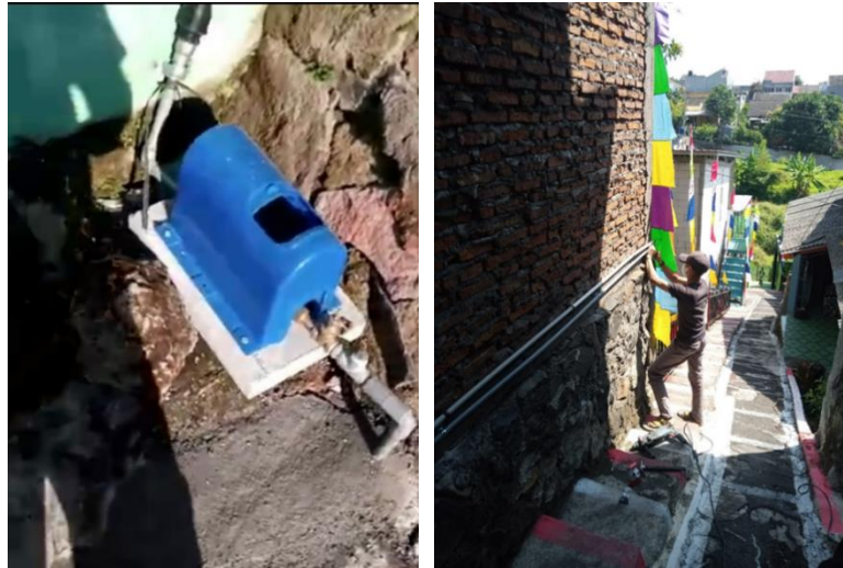
Gambar 2. Pemasanan PDAM dan Instalasi Distribusi Air