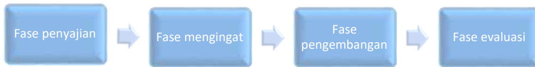
Gambar 1. Proses Penggunaan Game Berburu Harta Karun

Tahap Pertama , Langkah penyajian, pendidik memberikan suatu pertanyaan terkait dengan tema yang dipelajarinya dengan pemburuan harta karun di pembelajaran nahwu. Wawasan dasar disediakan untuk memberikan bantuan pada santri sehingga memiliki kemudahan dalam pemaknaan dari topik yang dipelajarinya. Pada langkah ini terdapat beberapa fase yang dilakukan pendidik terdiri dari langkah pertama yakni siswa dilakukan pembagian menjadi beberapa kelompok yang terdiri dari dua orang.